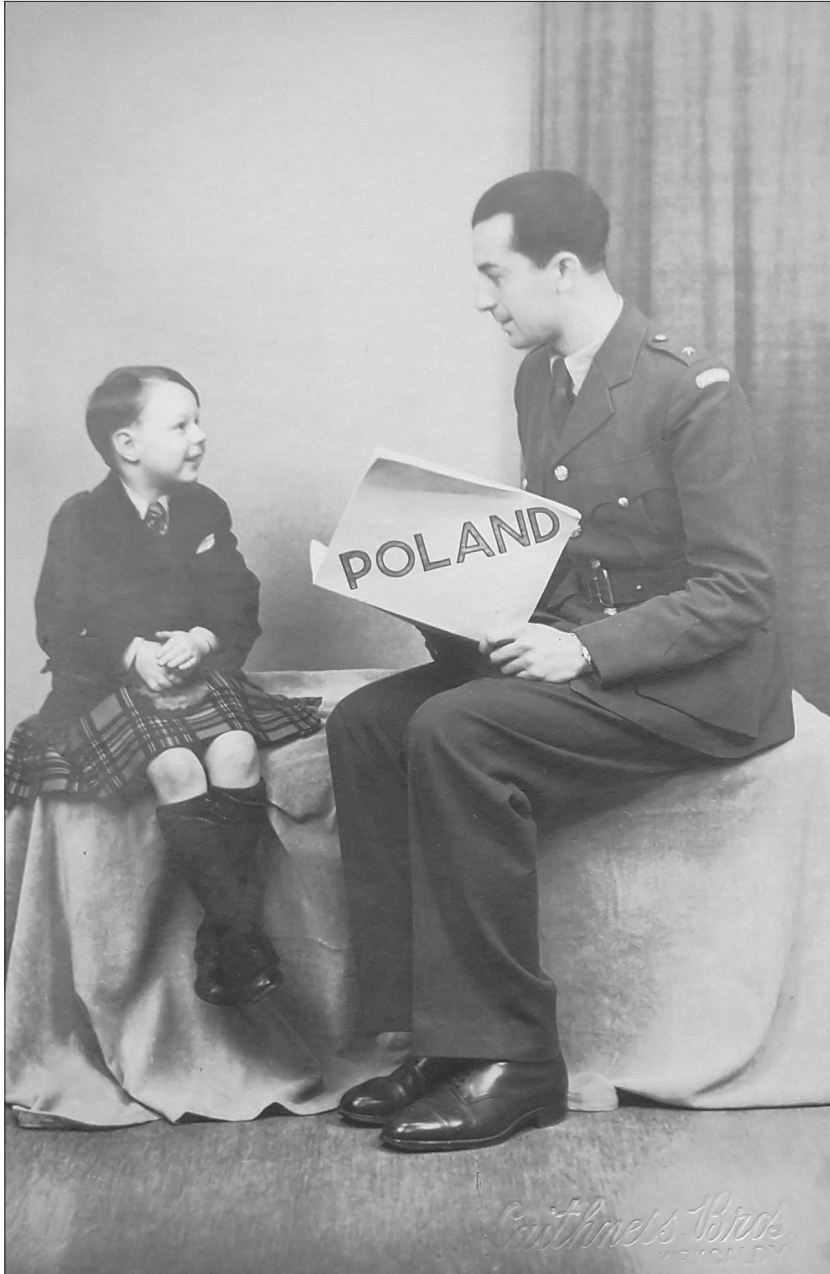
3. Fotografia przedstawiająca polskiego żołnierza z książką pt. Poland oraz siedzącego obok szkockiego chłopca. Lata 40. XX wieku