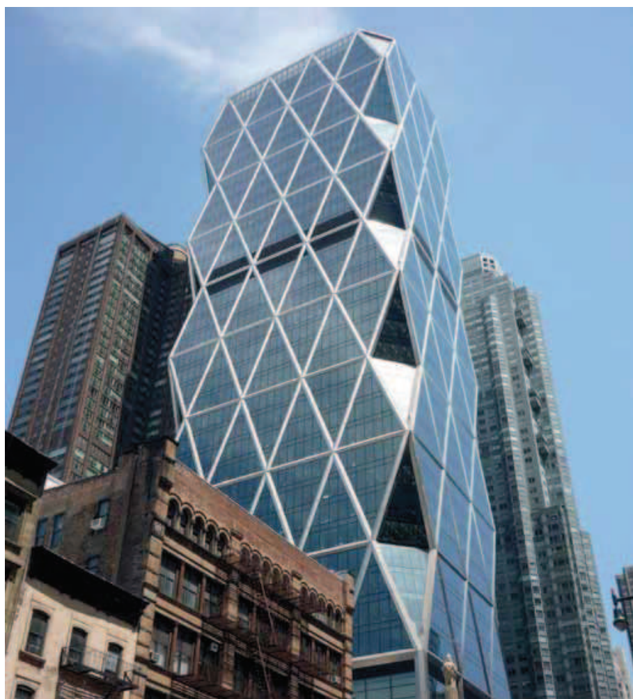
Hearst Tower di Norman Foster: New York, 2006.

In questo secondo approfondimento sulle prestazioni dell'involucro viene analizzato il contributo dei diversi elementi architettonici al benessere di chi fruisce di questi spazi. Dopo aver analizzato la sicurezza e le capacità di isolamento termico, in questo articolo vengono approfonditi i seguenti temi: l'illuminazione naturale e il controllo della luminosità interna, il benessere acustico e il mantenimento di una buona qualità dell'aria interna