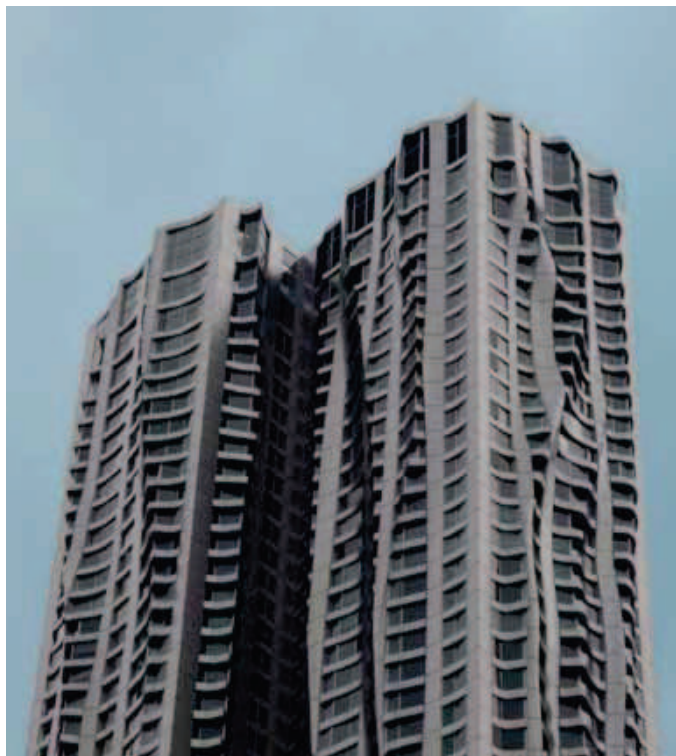
Beekman Tower di F.O. Gehry: New York, 2010.

realmente significativo e per questo motivo vengono ideati sistemi in grado di controllare la radiazione solare. Appare quindi importante valutare l'entità del fenomeno dell'abbagliamento. Questa valutazione risulta molto complessa in quanto possono essere effettuate valutazioni soggettive, dipendenti dalle sensazioni provate dai singoli utenti. Uno dei meccanismi per individuare il discomfort da abbagliamento è quello correlato alla definizione del Daylight Glare Index (DGI 7 ), che viene utilizzato per indicare la risposta soggettiva a sorgenti luminose a larga scala. Il DGI può essere applicato unicamente a fonti di luce con distribuzione omogenea come, ad esempio, la luminanza del cielo uniforme attraverso una finestra.