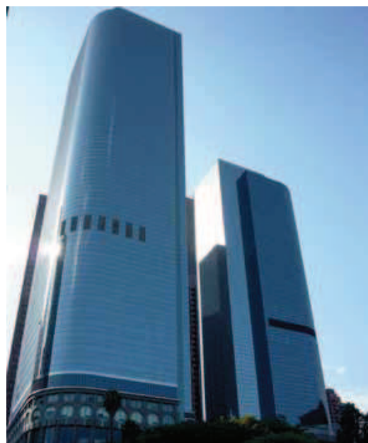
Two California Plaza di Arthur Erickson Architectural Corporation: Los Angeles, 1992. Fotografia dell'autore

manuale dell'IESNA, la norma Uni 10530 del 1997 5 riporta i valori dei livelli di illuminamento in funzione delle attività svolte all'interno degli ambienti. Attualmente questa norma è stata ritirata, ma è comunque stata emanata, nel 2004, la norma Uni EN 12464-1, che determina le condizioni di illuminamento dei posti di lavoro all'interno degli edifici trattando, nello specifico, le condizioni di illuminamento artificiale.