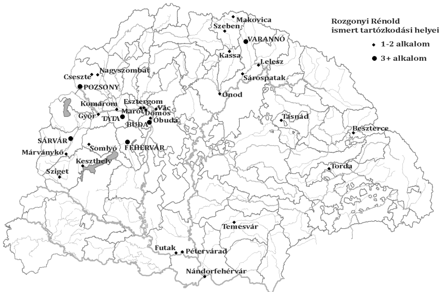
2. térkép: Rozgonyi Rénold ismert tartózkodási helyei