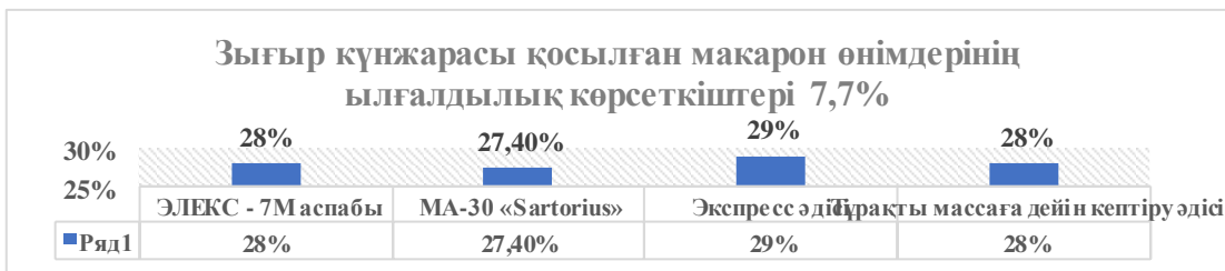
Сурет 3 - 7,7% зығыр күнжарасы қосылған «шикізатты сығу» процедурасынан кейінгі макарон өнімдері