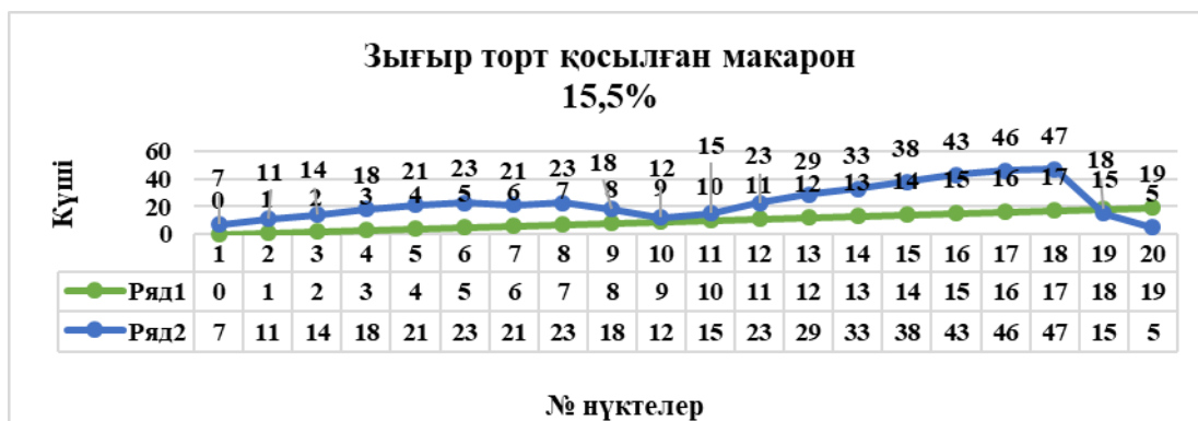
Сурет 8 - 15,5% зығыр күнжарасы қосылған макаронның реологиялық көрсеткіштері

Жүргізілген зерттеулер нәтижесінде макарон пішінінің сақталуы бойынша 3,8%, 7,7% және 15,5% зығыр күнжарасы қосылған макарон өнімдері пісіру уақытын қысқартқан жағдайда жоғары сортты ұннан жасалған макарон өнімдеріне ұқсайды.