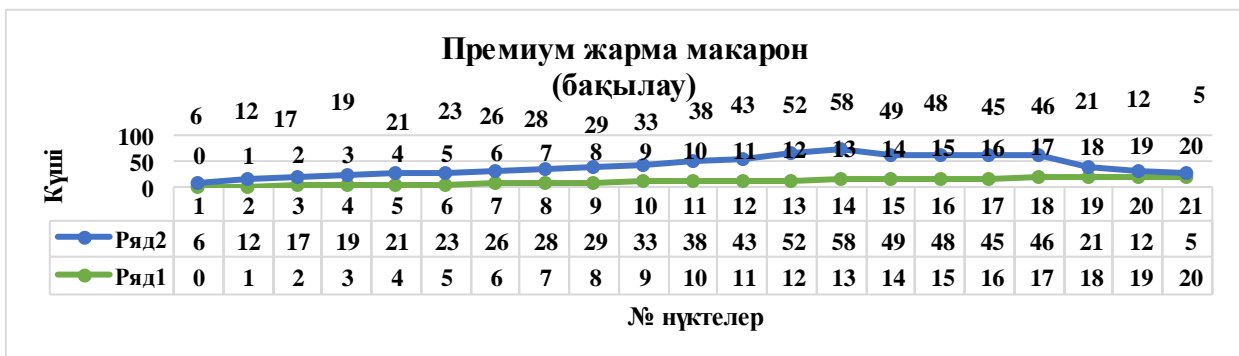
Сурет 5 - Бақылау үлгісі бойынша «Структурометр СТ-1М» құрылғысының мәліметтері

дерінің пішінінің сақталуын анықтау анализатор структурометр СТ-2 құрылғысында жүргізілді.