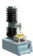
Сурет 1 - Структурометр СТ-2 құрылғысы

Зерттеу жұмыстары аясында зығыр күнжарасы қосылған макарон өнімдерінің 3,8%, 7,7% және 15,5% «пішінді сақтау» бойынша сапа көрсеткіштері анықталды. Макарон өнімдерінің «пішінін сақтауын» анықтау текстуралық анализатор «Структурометр СТ-2» құрылғысында жүргізілді.