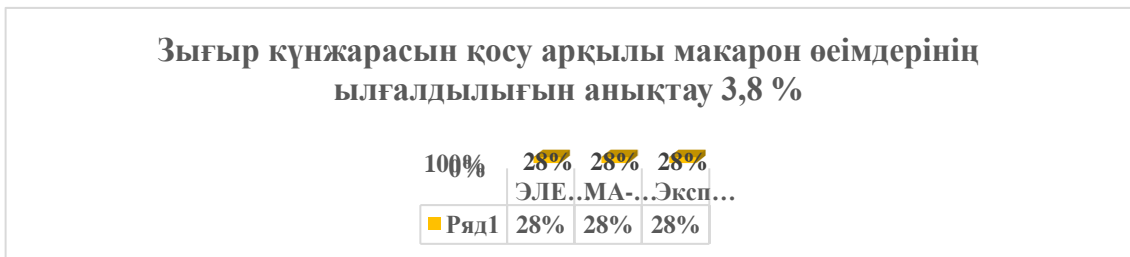
Сурет 2 - 3,8% зығыр күнжарасы қосылған «шикізатты сығу» процедурасынан кейінгі макарон өнімдері

сығу» процедурасынан кейінгі макарон өнімдерінің ылғалдылықтары көрсетілген.