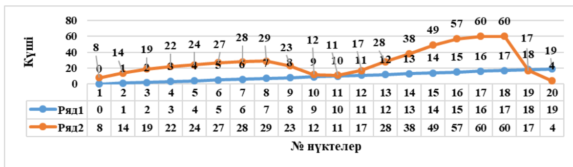
Сурет 6 - 3,8% зығыр күнжарасы қосылған макаронның реологиялық көрсеткіштері