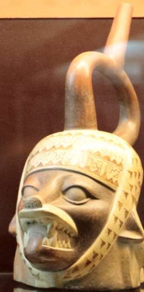
Vasijas Moche, costa Norte del actual Perú