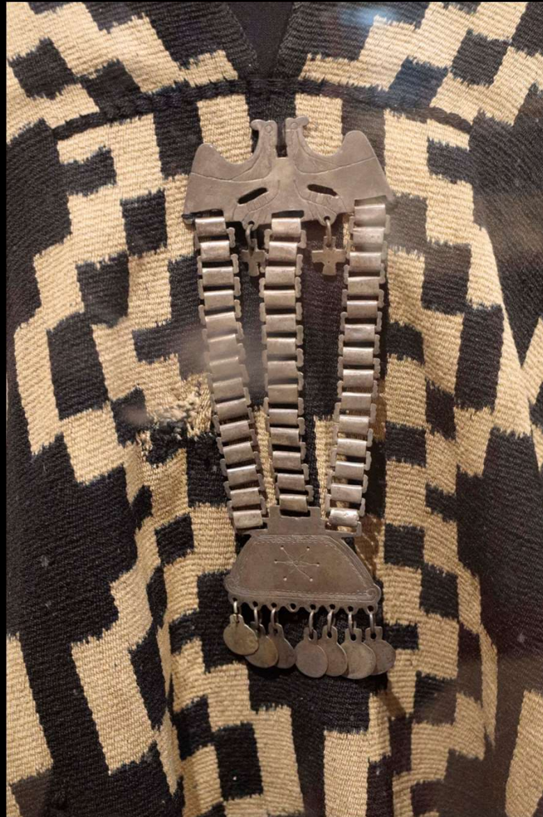
Poncho tejido a telar y prendedor de plata mapuche