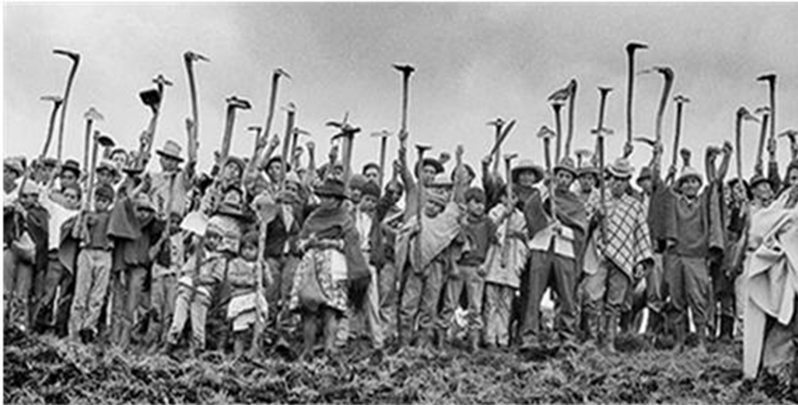
Reforma agraria en Ecuador. Portada: Primer Congreso Indigenista Interamericano, 1940.