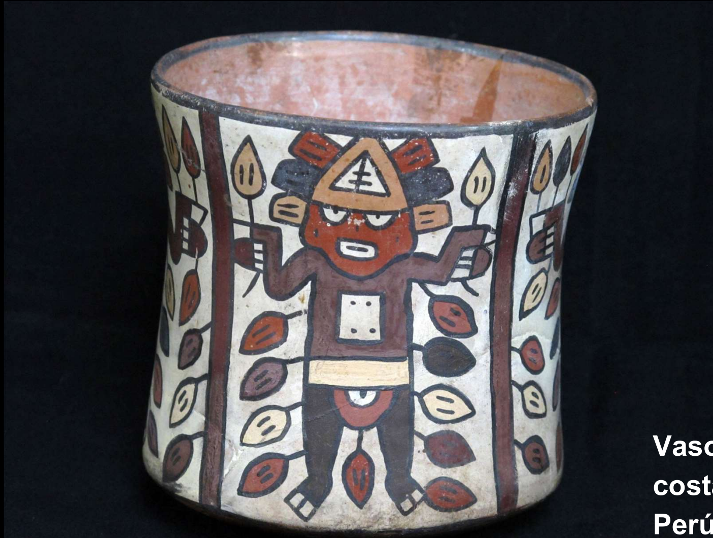
Vaso Nasca, costa sur del Perú actual