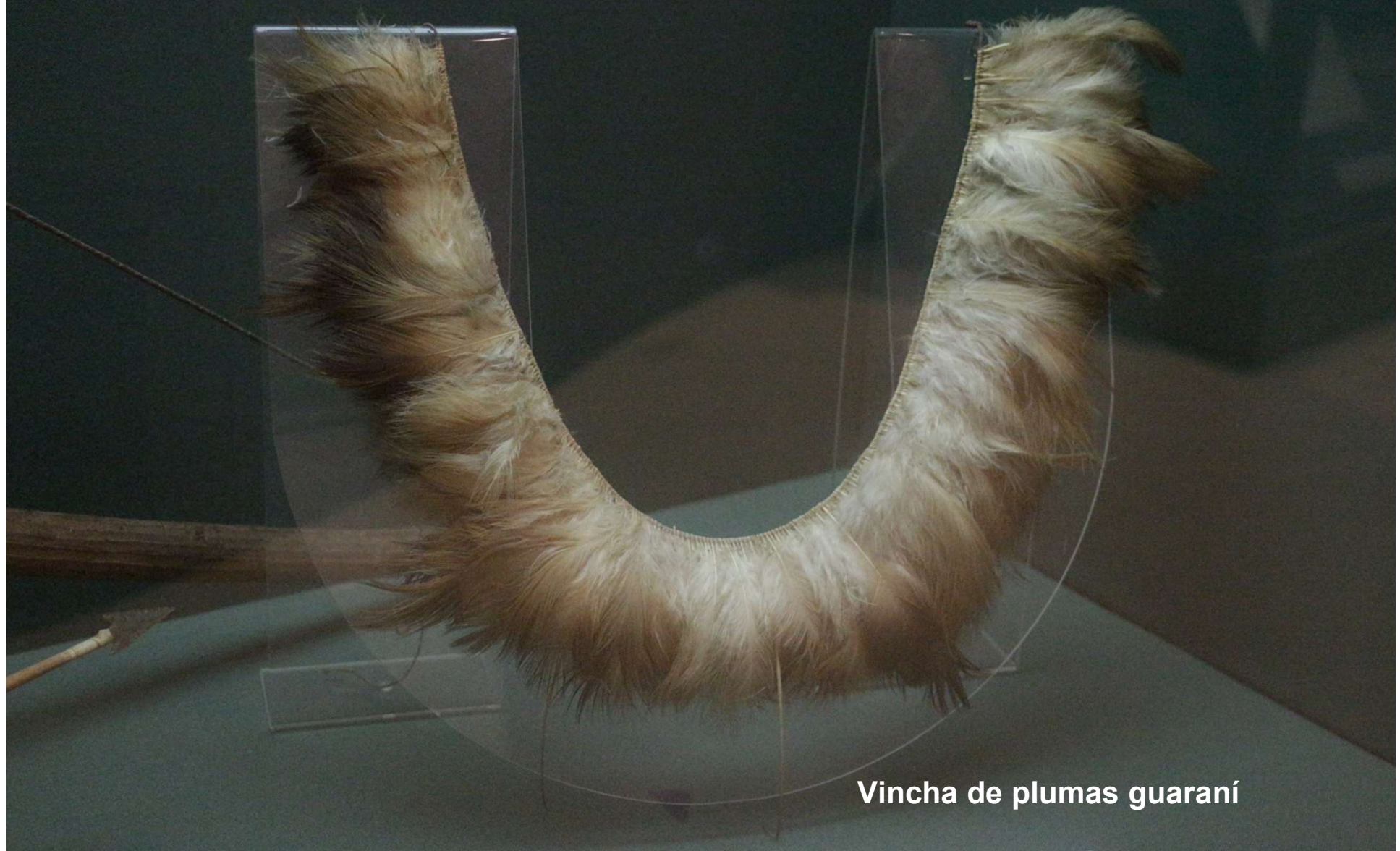
Vincha de plumas guaraní