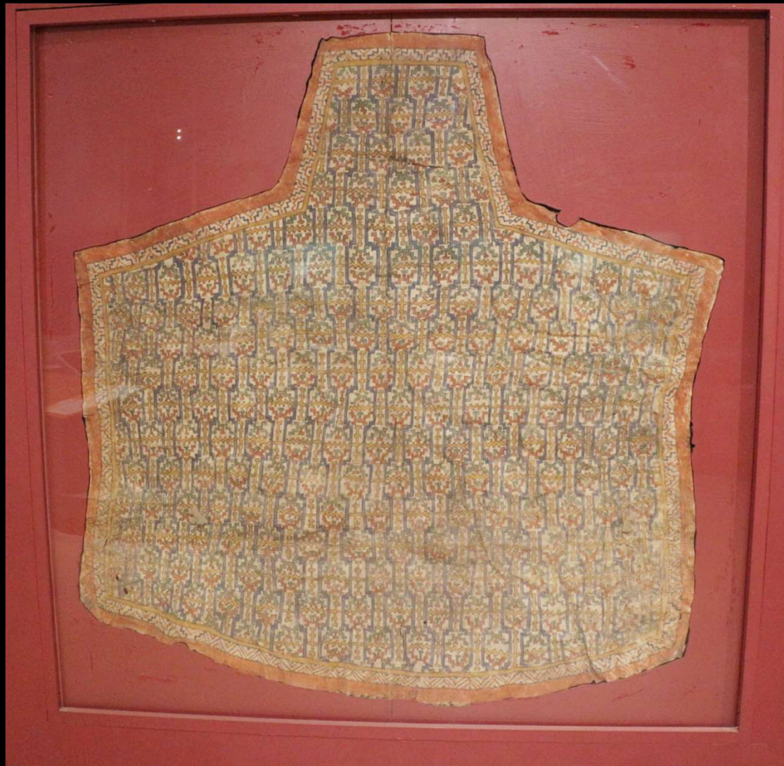
Quillango, manto tehuelche