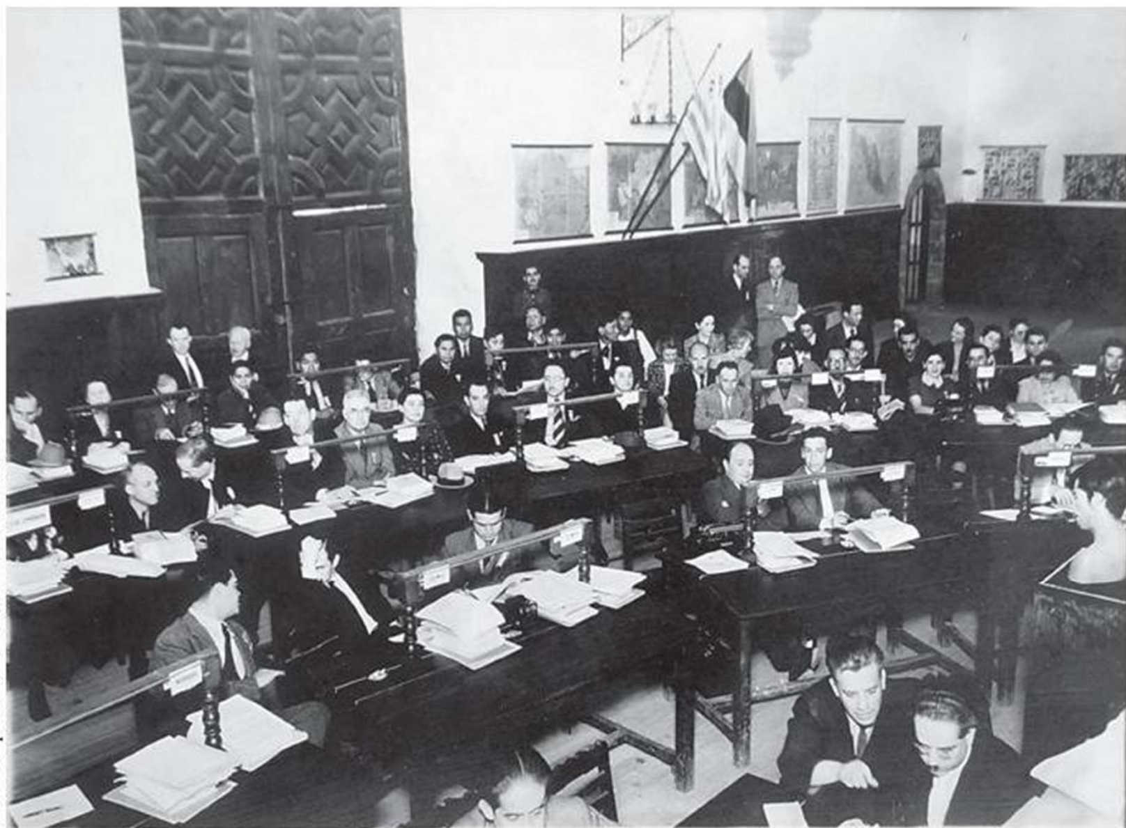
Las mesas de los congresistas. Primer Congreso Indigenista Interamericano, Pátzcuaro, Michoacán, 1940.