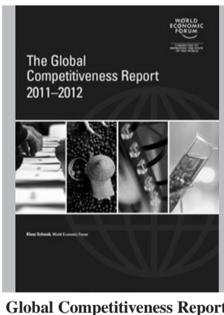
Global Competitiveness Report