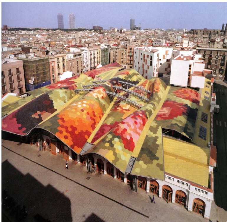
Fig. 1. EMBT, Mercato coperto di Santa Caterina, Barcellona, 2005