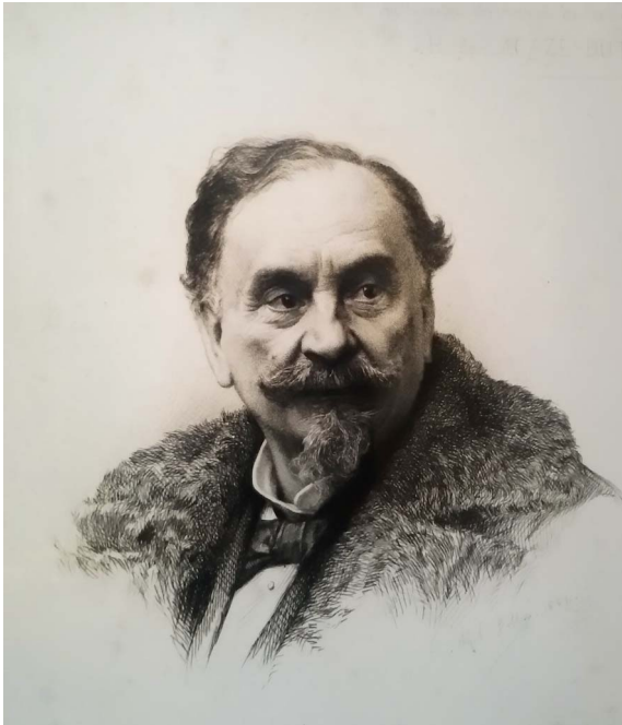
Figure 1. Engraving by Ch. B. May dedicated, in 1896, “To the creator of the stations of Roscoff and Banyuls, H. de LACAZE-DUTHIERS. Offered by his pupils and by many French and foreign scholars as a token of admiration for his work and his sacrifices to Science” [5].

Roscoff in 1872 (now the Biological Station), and the Arago Laboratory in Banyuls-sur-Mer in 1882 (now the Oceanological Observatory).