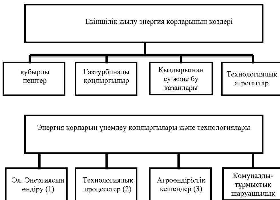
Сурет 1 - Екіншілік жылу энергия қорларының түрлері