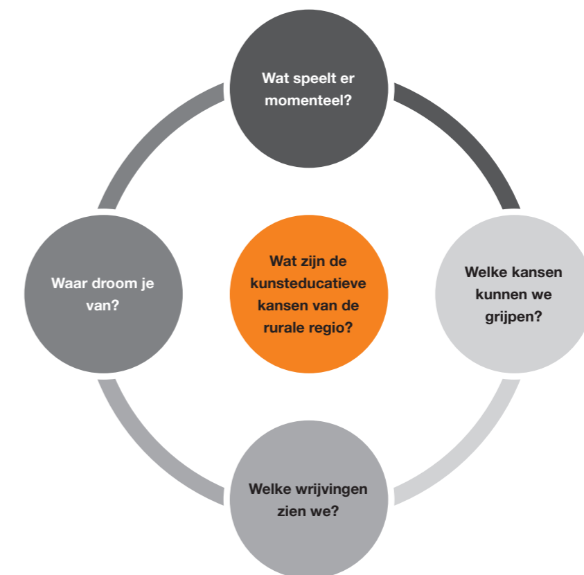
Figuur 1: tafelvragen

Aan iedere tafel staat de hoofdvraag en één deelvraag centraal waar de aanwezigen over uitwisselen. De avond bestaat uit twee rondes; na de eerste ronde wisselt iedereen van tafel, van groep en van vraag. De tafelhosts blijven zitten en lichten kort toe wat er in het voorgaande gesprek gezegd is. Zo ontstaan er nieuwe groepen en door voort te bouwen op de vorige groep kunnen de gesprekken zich verdiepen.