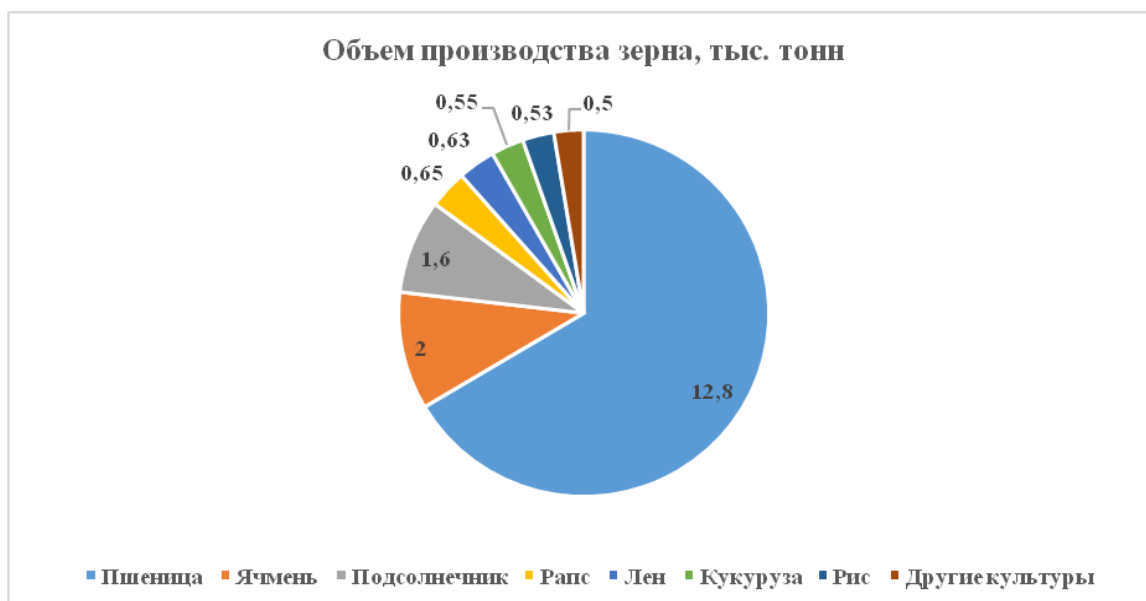
Рисунок 2 Объем производства зерна в Республике Казахстан в 2019 году.

Пшеница является основным сельскохозяйственным сырьем в Казахстане, что подтверждается данными Комитета по статистике Министерства национальной экономики Республики Казахстан и агентства Казах-Зерно [5, 6]. Так, в 2019 году собрано более 19 млн. тонн зерна, из которого более 12 млн. тонн представлено пшеницей (рис. 2).