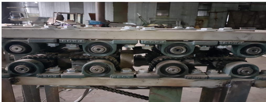
2 сурет. Тінді талшықтарды тегістеу машинасы

режесін анықтау үшін өтуге байланысты үлгілер дайындалды.