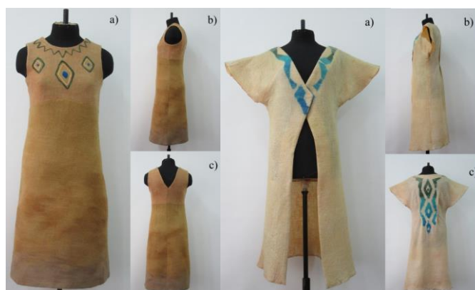
Figure 2 - demi-season nunofelt dress a)- front view b) - side view c) - back view

Products made from developed modified canvases have a number of advantages: high heat-shielding properties; aesthetic indicators; not subject to crumbling; have an original artistic solution (Fig. 2, Fig. 3).