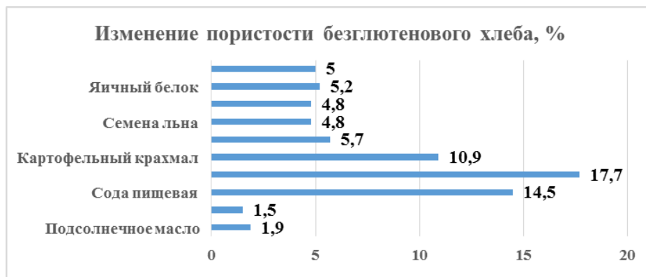
Рисунок 4. Влияние различных улучшителей на изменение пористости опытных образцов безглютенового хлеба с добавками и без добавок

Данные показывают, что подсолнечное масло незначительно, но более благоприятно влияет на пористость, по сравнению с оливковым маслом – если оливковое масло увеличило пористость на 1,5%, то подсолнечное масло – на 1,9%, также, как сухие дрожжи, которые увеличили пористость на 17,7%, тогда, как пищевая сода – на 14,5%. Полученные данные позволили определить следующие улучшители, которые будут включены в состав мучной смеси и теста: подсолнечное масло, сухие дрожжи, яичный белок, семена льна (или льняная мука), картофельный крахмал.