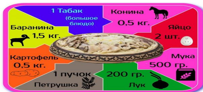
Рисунок 1. Рецепт одного блюда бешбармака.

Так, отечественная исследовательская компания в сфере маркетинга ISAS проанализировала движение «индекса бешбармака» с начала 2015 года, который представляет из себя отношение средней зарплаты к цене одного большого блюда бешбармака и показывает, сколько блюд бешбармака в месяц может приготовить среднестатистический наемный работник. В своем исследовании аналитики ISAS использовали следующий рецепт бешбармака (рис.1):