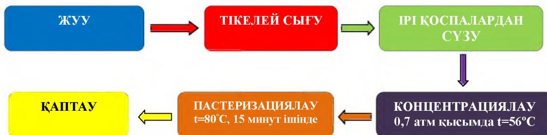
1-сурет - Жүзім, алма және шие концентраттарын дайындаудың технологиялық схемасы

масы 1-суретте көрсетілген. Бұл әдіс целлюлозаның минималды құрамымен көрсетілген шикізаттан шырынды толық сығу мүмкіндігіне байланысты таңдалды.