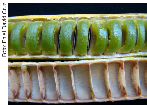
Figura 2. Parte do fruto de mari-mari aberto.

água por 24 horas. Posteriormente, devem ser atritadas em uma peneira até se apresentarem completamente desprovidas de resíduo de polpa. Em seguida, deve ser removida a estrutura coriácea que envolve a semente (Figura 4).