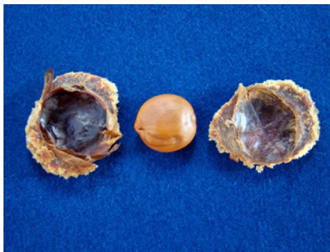
Figura 4. Semente de mari-mari após a remoção da estrutura coriácea.