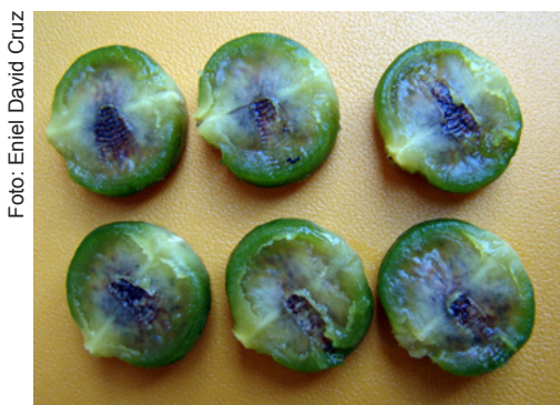
Figura 3. Sementes de mari-mari com a polpa aderida.