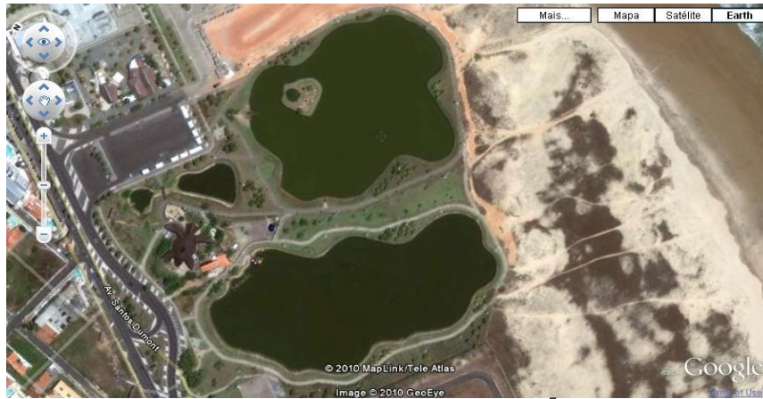
Figura 2 - Região dos Lagos 7

Esses equipamentos são um dos mais frequentados da OA, contém um público bastante amplo. Devido ao seu posicionamento próximo à rede hoteleira, observamos a presença de muitos turistas no local, especialmente em feriados e finais de semana, bem como uma ampla presença da população local. O equipamento é utilizado para caminhadas, corridas, passeios de bicicleta ou de pedalinho, passeios familiares ou com animais de estimação e para contemplação da paisagem. Outra característica desse equipamento é a ampla área comercial que se estende ao seu redor. Trata-se de um lugar propício para o fluxo de turistas de diversas localidades, uma vez que se posiciona próximo à rede hoteleira, especialmente em feriados prolongados e finais de semana. Entretanto, em nossas entrevistas, identificamos que a parte norte da Orla apresenta dificuldade de acesso pelos moradores que dependem do transporte público, pois fica distante do Terminal de Integração de Atalaia - Zona Sul e, mesmo os ônibus que transitam pela Orla, não chegam até este local, o que nos leva a pensar numa menor frequência de parte da população que não dispõe de transporte próprio.