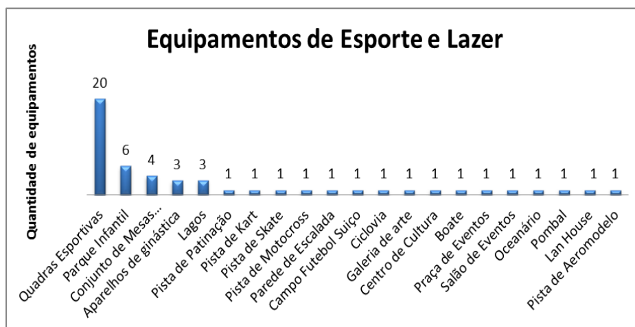
Gráfico 1: Equipamentos de Esporte e Lazer da Orla de Atalaia

Mas afinal, esse público frequentador da OA e os demais integrantes da população aracajuana e da região metropolitana encontram que tipos de equipamentos de esporte e lazer a sua disposição nesse espaço? O mapeamento dos 6 km de extensão da OA nos permitiu identificar um total de 52 (cinquenta e dois) equipamentos específicos de esporte e lazer, de 21 (vinte e um) tipos diferentes ao longo dos 6km de extensão da OA (Gráfico 1), o que demonstra uma certa diversidade de opções no oferecimento de práticas de esporte e lazer em toda sua extensão.