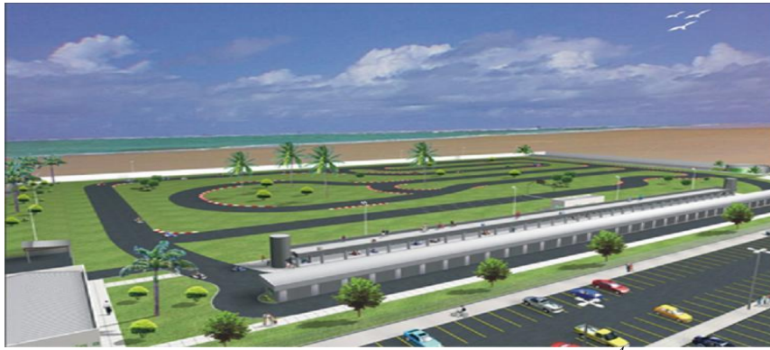
Figura 1: Kartódromo Emerson Fittipaldi 4

Esta “privatização” que está acontecendo na OA se deve ao modelo de gerenciamento deste espaço público aracajuano/sergipano, que é realizado em parceria com entidades como Associações e Federações Esportivas. Assim, tais entidades foram contempladas com locais específicos para suas modalidades esportivas na OA e oferecem, em contrapartida, a responsabilidade de gerenciamento dos mesmos.