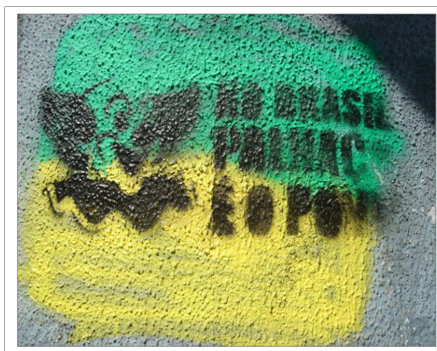
Figura 2 - Grafite: “No Brasil palhaço é o povo”.

Mas encontramos, como que no subsolo das organizações sociais, um pouco também do satírico, do cômico que se faz crítico. Encontramos o palhaço. Grafitada sobre um fundo verde e amarelo, cravada em negro na parede chapiscada de uma pequena loja do centro da cidade, na esquina entre as ruas Felipe Schmidt e Álvaro de Carvalho, a face irônica subscrevia: “No Brasil palhaço é o povo”. No seio do circuito discursivo, a cidade produz estas vozes discordantes, dissonantes, corrosivas. No grafite, na contramão da Copa (e do mundo?), teias se entrelaçam, confundem, dispersam, ironizam.