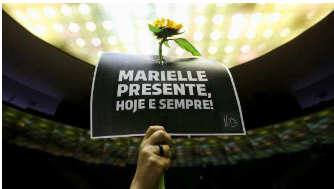
Figura 7: O fim é o começo

O destaque dado para as trajetórias de mulheres negras deve-se ao meu entendimento de que essas mulheres precisam sair da invisibilidade a que estão submetidas na sociedade. Sua participação na sociedade brasileira foi historicamente atrelada à imagem das criadas, das mães-pretas, ou das práticas sexuais “livres” e “desonrosas”. Quando há uma alusão a estas mulheres nos estudos e pesquisas sobre gênero ou mesmo sobre relações raciais, elas aparecem como participantes das profissões de baixa remuneração e pouca valorização social como é o caso do emprego doméstico.