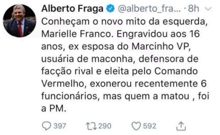
Figura 1: Comentário Alberto Fraga Fonte: ATAQUE (2018)

Iniciemos analisando o seguinte comentário polêmico do deputado João Alberto Fraga Silva, conhecido popularmente como Alberto Fraga. Como é possível constatar em sua biografia no site institucional da Câmara de Deputados: “Policial, deputado, com curso superior na esfera militar, pessoa pública”, esclarecida. Assim apresentamos Fraga antecedendo seu comentário a respeito da morte da parlamentar Marielle Franco.