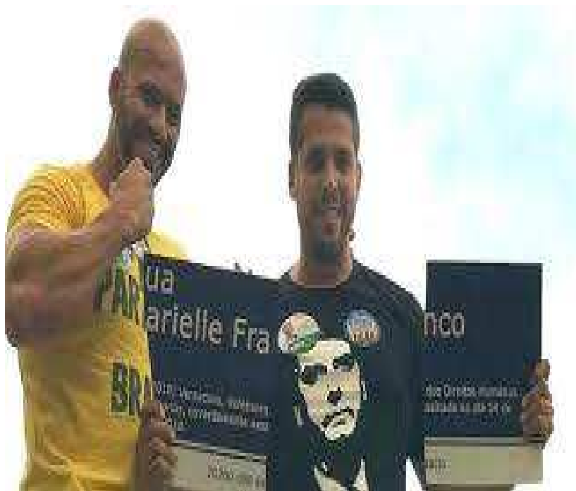
Figura 4: Destruição de placa homenageando Marielle

Observemos que há uma inversão imagética: no centro, a imagem que aparece é de Jair Bolsonaro, enquanto dois homens brancos e heteronormativos – um deles vestindo a camisa verde e amarela, espécie de símbolo da Nova Direita – fecham os punhos. O discurso de luta é invertido, contra a memória de Marielle. “Bandida”, ela deverá ser execrada publicamente e essa execração multiplicada em likes e compartilhamentos.