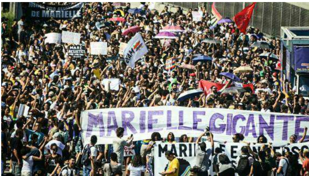
Figura 5: Ecos na periferia.