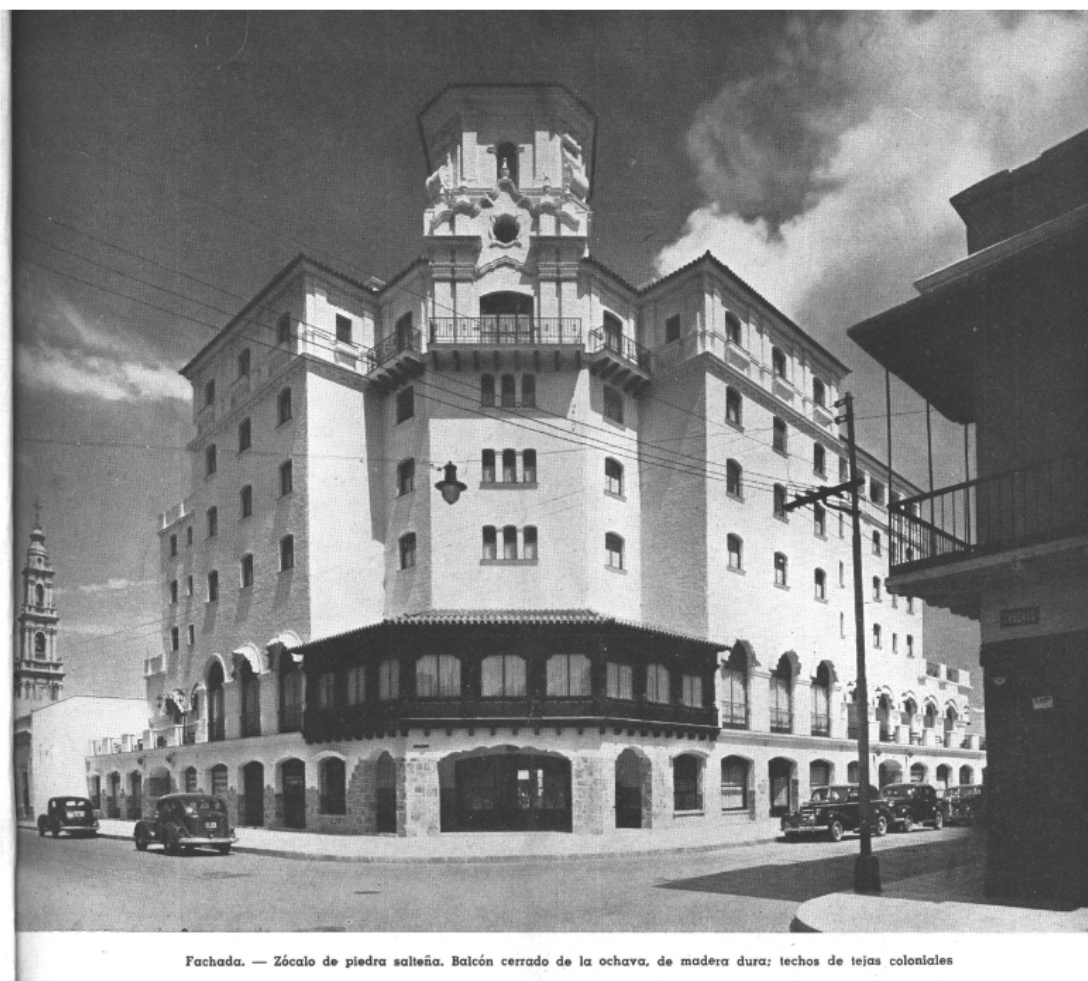
Fachada. — Zócalo de piedra salteña. Balcón cerrado de la ochava, de madera dura; techos de tejas coloniales

Fotografía N° 1. Fachada del Hotel de Salta. Fuente: "Hotel Salta" (02/ 1943). Nuestra Arquitectura , N° 163, p. 119.