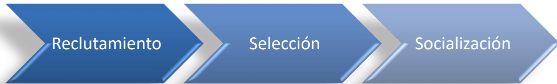
Gráfico 1. Proceso de afectación