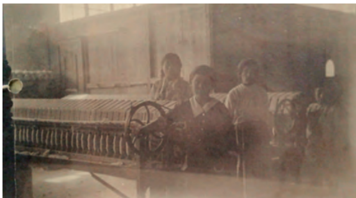
Imagen 1. Niños que dan vuelta a las manivelas para enredar el hilo Distrito Federal, México, 1920 15 .