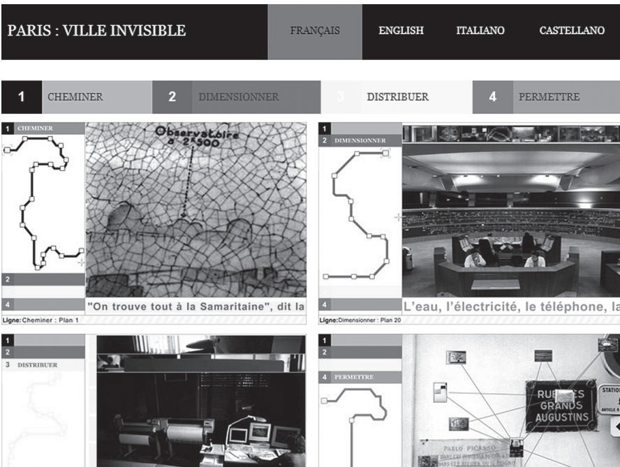
Abb. 2: Website Paris: Ville invisible

bes Netzwerk bleibt in allen Punkten lokal.« 60 Das Konzept der Metrologie impliziert damit eine spezifische Flachheit des infrastrukturellen Netzes, derzufolge es möglich ist, »sich lokal überallhin auszubreiten« und so das Lokale wie das Universale zu umgehen. 61