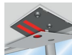
z. B. Deckenverkleidungen