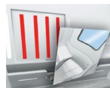
z. B. Spiegelverklebung