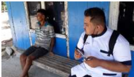
Gambar 1. Wawancara tentang kondisi anak autism spectrum disorder dan edukasi pola asuh anak autism spectrum disorder.

Dalam kegiatan ini penulis tidak mengambil data secara objektif, namun penulis mengambil data secara observasi dan tanya jawab dengan orang tua anak tersebut.