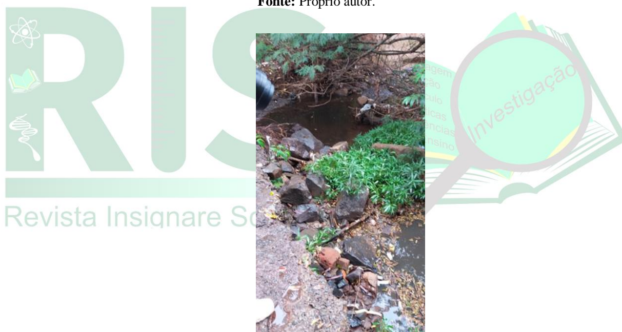
Figura 06 - Imagem da interligação entre os poços