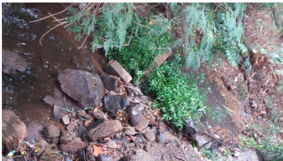
Figura 05 – Galeria fluvial que desemboca na nascente