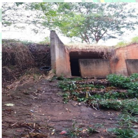
Figura 04 - Galeria fluvial que desemboca na nascente.

Dentre as irregularidades, pode-se observar o término de uma galeria fluvial que desemboca próxima a nascente. Constatou-se no entorno a presença de uma frágil vegetação nativa o que propicia o aparecimento de erosão de vale que se intensifica com as enxurradas provenientes de galerias. Esse fato provoca o assoreamento do curso d'água, conforme demonstrado na foto da Figura 4. Todo curso d'água normalmente apresenta um equilíbrio em relação ao transporte de sedimento, seja por arrasto e saltitação junto ao leito, seja em suspensão na corrente, e existe uma tendência natural para que este seja depositado quando o fluxo natural de sedimentos ao encontrar água com menor velocidade (alteração do fluxo) começa a se depositar, conforme a maior ou menor granulação das partículas e a menor ou maior turbulência do escoamento (CARVALHO. 2000).