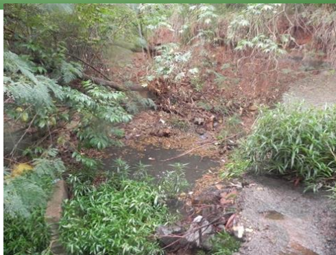
Figura 2 -Imagem da atual nascente.