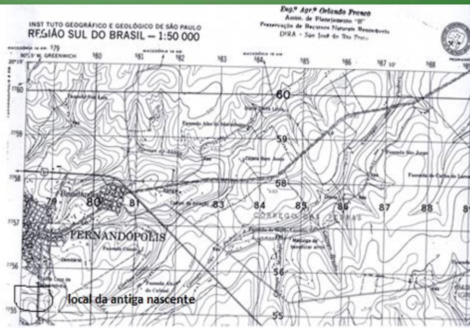
Figura 01 – Localização da antiga nascente indicada pela carta topográfica.