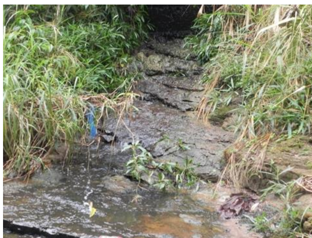
Figura 08 - Galeria fluvial que desemboca no curso do Ribeirão.