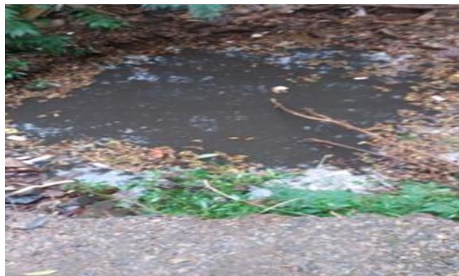
Figura 09 - Imagem mostrando a péssima qualidade da água da nascente.

Com relação à aparência da água, observou-se uma maior turbidez na nascente em relação às águas coletadas no curso do Ribeirão. As águas da nascente mostraram-se bastante escuras e fétidas (Figura 9), provavelmente pelo despejo de esgoto doméstico, conforme demonstrado na Tabela 1.