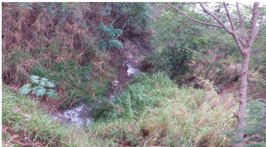
Figura 07 - Afilamento do curso d'água ao longo do percurso.