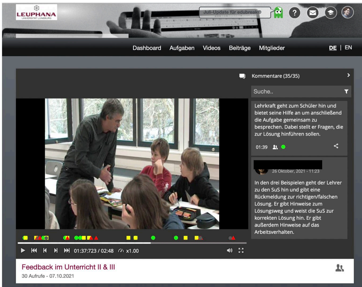
Abb. 4: Von den Teilnehmer*innen analysierte Feedbacksituation in einem Videobeispiel

Da Fortbildungen möglichst eng in die professionellen Kontexte der Adressaten eingebunden werden und sie individuell begleiten sollten, um nachhaltige Veränderungsprozesse in Gang bringen zu können, simulierten die Teilnehmer*innen in Tandems Feedbacksituationen im Unterricht, filmten ihren eigenen Unterricht und analysierten das Unterrichtsvideo ihrer*s Tandempartners*in mit Hilfe der kennengelernten Feedback-Kriterien im Online-Kurs. Zudem hatten sie die Möglichkeit, im Verlauf der Fortbildung ein Coaching-Gespräch mit den Workshop-Referent*innen in Anspruch zu nehmen. Nach Abschluss der Fortbildung erhielten alle Teilnehmer*innen ein Zertifikat mit Angaben zu Inhalten und Umfang des Lehrgangs.