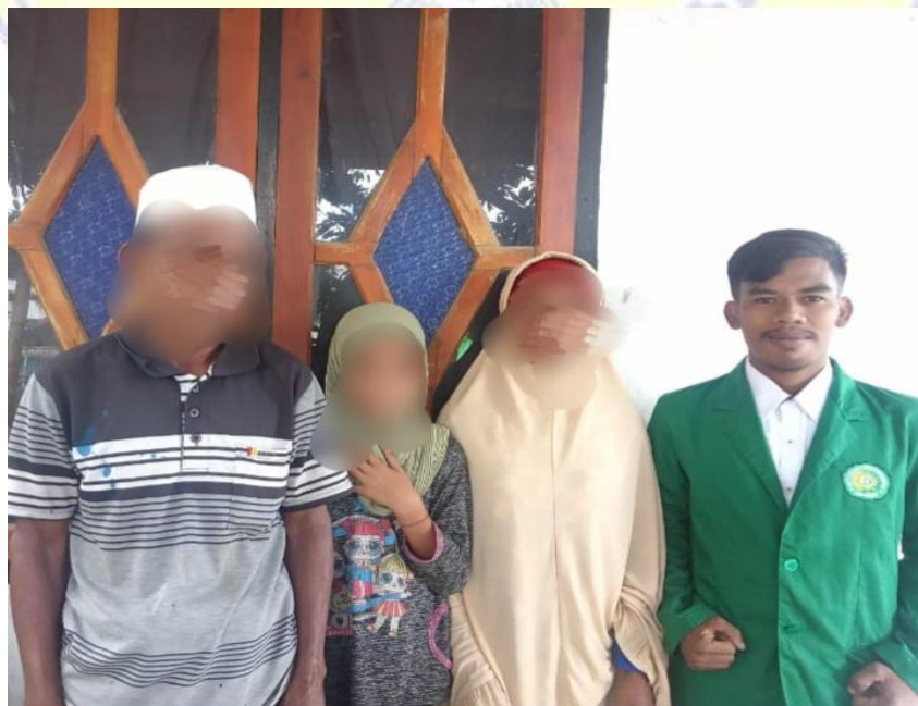
KORBAN DAN ORANG TUA KORBAN