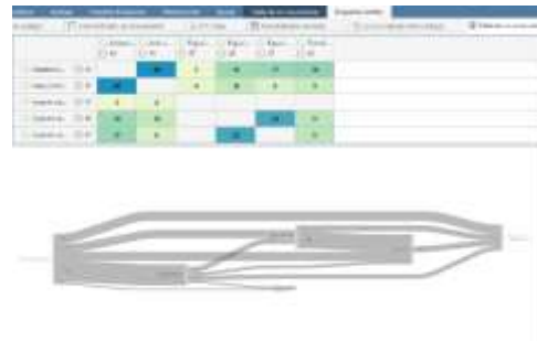
Imagen 6. Diagrama de Sankey.

Tabla de Co-ocurrencias. Diagrama de Sankey. Es tabla genera información de cómo se relacionan ciertos códigos entre sí. Es decir, cuando dos códigos codifican la misma cita que están en contacto físico una con la otra. En este caso se cruzan los códigos emergentes entre sí y se determinan los grados de influencias recíprocos.