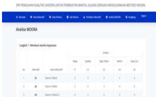
Gambar IV.7 Halaman Analisa Metode MOORA

Pada halaman ini pengguna dapat melihat analisa dari metode MOORA. Tampilan dari halaman analisa MOORA adalah sebagai berikut :