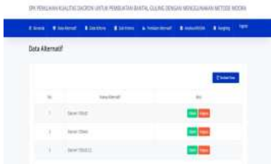
Gambar IV.3 Halaman Data Alternatif

Pada tampilan halaman data alternatif, pengguna dapat menginput data alternatif. Selain melakukan input data alternatif, pengguna juga dapat melihat data yang sudah di input serta melakukan edit data jika ada kesalahan atau melakukan hapus data. Tampilan dari halaman alternatif adalah sebagai berikut: