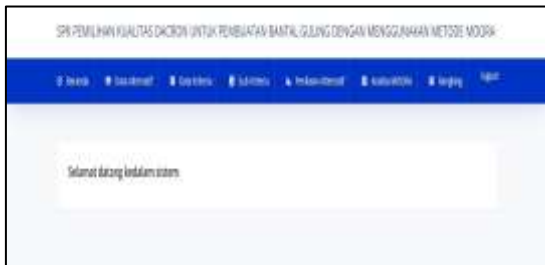
Gambar IV.2 Halaman Beranda

Setelah pengguna berhasil masuk kedalam sistem, pengguna akan diarahkan halaman beranda. Halaman ini adalah halaman utama yang menampilkan menu yang dapat diakses oleh pengguna. Hasil dari implementasi halaman beranda dapat dilihat pada gambar berikut ini: