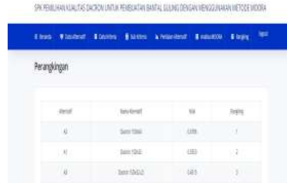
Gambar IV.8 Halaman Hasil Rangkings

Pada halaman ini admin dapat mengetahui rangking dari data supplier yang telah dihitung menggunakan metode MOORA. Tampilan dari halaman perankingan adalah sebagai berikut :