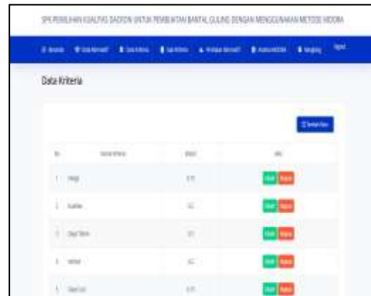
Gambar IV.4 Halaman Data Kriteria

kesalahan atau melakukan hapus data. Hasil dari implementasi halaman data kriteria dapat dilihat pada gambar berikut: