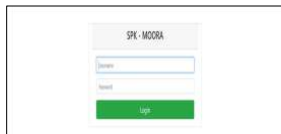
Gambar IV.1 Halaman

Halaman login akan ditampilkan pertama kali sebelum pengguna masuk kedalam sistem. Pengguna dapat masuk kedalam sistem menggunakan username dan password yang dimiliki. Hasil dari implementasi halaman login dapat dilihat pada gambar berikut ini: