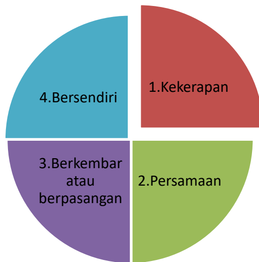
Rajah 3: Asas Pembahagian Kategori Huruf