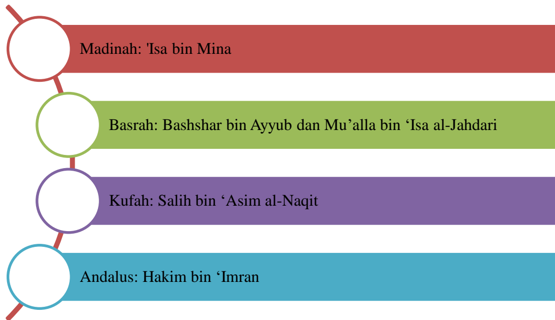
Rajah 1: Ulama Penulisan Dan Penandaan Yang Masyhur Mengikut Negeri

Selain daripada ulama yang tersebut di atas, telah terdapat ulama yang masyhur dalam bidang penulisan dan penandaan di setiap negeri dalam kalangan mutaqaddimin (ulama terdahulu). Rajah 1 menunjukkan senarai sebahagian daripada ulama terdahulu yang masyhur berdasarkan negeri masing-masing;