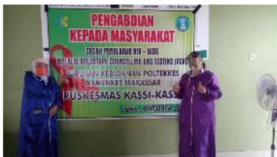
Gambar 1. Spanduk kegiatan PKM Permasalahan mitra sebagai berikut:

Program Kemitraan Masyarakat (PKM) yang telah dilaksanakan bermitra dengan bidan dan kader posyandu di wilayah kerja Puskesmas Kassi - Kassi Kota Makassar.