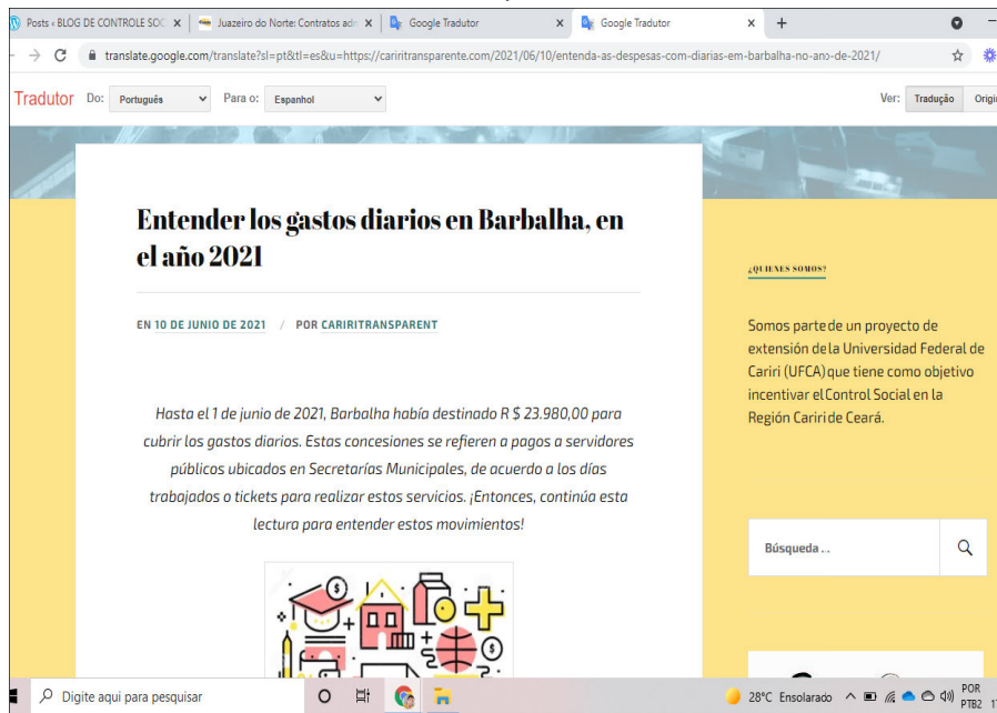
Figura 7. Publicación referente a gastos diarios en Barbalha, hasta el 1 de junio de 2021