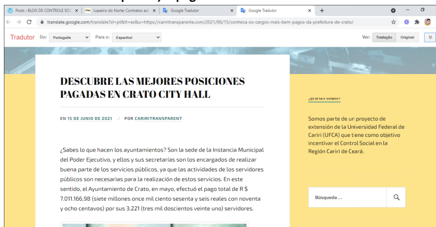
Figura 6. Publicación referente a los puestos que mejor pagan en la ciudad de Crato