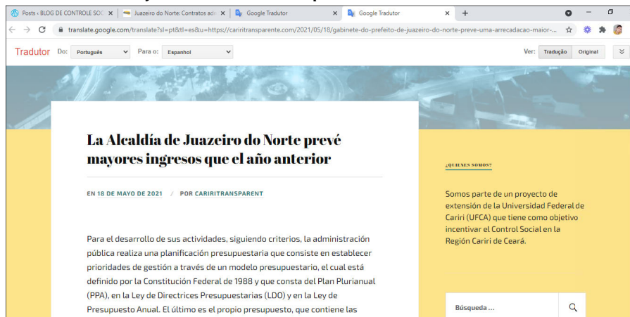
Figura 5. Publicación referente a la previsión de ingresos en Juazeiro do Norte, superior a la del año anterior