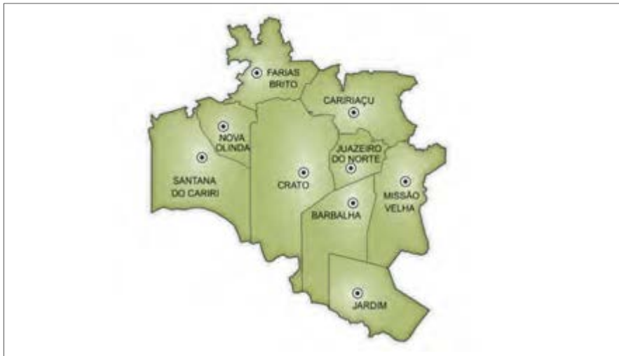
Figura 1. Ciudades que componen la Región Metropolitana de Cariri