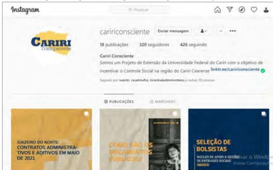
Figura 8. Página de Instagram del Blog Cariri Transparente