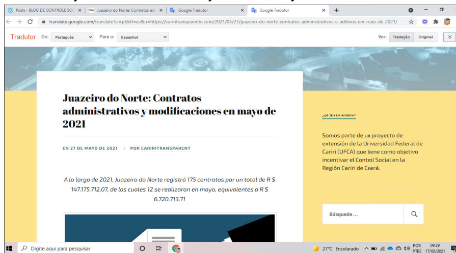
Figura 4. Publicación referente a contratos administrativos y modificaciones en mayo de 2021, en Juazeiro do Norte