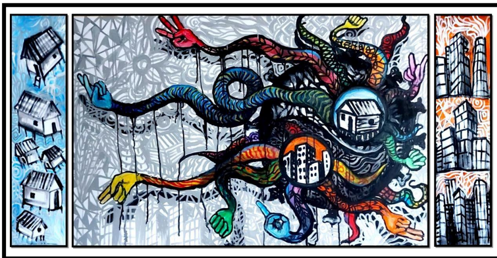
Gambar 5. Isyarat ; 100 x 200 cm (tiga panel); cat akrilik pada kanvas, 2021

Tangan-tangan tersebut membantuk dua kata dari bahasa isyarat Indonesia, yaitu Daur Waktu . Pada lukisan ini berbicara tentang realitas terkini terkait dengan wabah virus Covid 19 . Bentuk Covid 19 itu divisualkan dengan latar bulat berwarna hitam yang berada di balik tangan-tangan. Kemudian di antara tangan-tangan tersebut ada rumah gubuk yang merepresentasikan kehidupan desa dan tangan-tangan yang di ujung adalah bangunan gedung menjadi simbol kehidupan kota. Kanvas pada bagian kiri merepresentasikan desa dan kanvas pada bagian kanan merepresentasikan keadaan kota. Hari-hari ini pandemi Covid 19 banyak menimbulkan misteri. Covid 19 hampir menyerang seluruh kota-kota besar di dunia tidak terkecuali di Indonesia. Jumlah yang terkonfirmasi positif pun semakin hari semakin bertambah. Namun ajaibnya ada satu desa bernama Desa