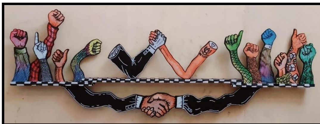
Gambar 4. Mengapa kita bersandiwara ; 80 x 180 cm; kayu dan cat akrilik, 2021

Terlihat tangan-tangan tersebut sedang menyaksikan dan memberikan semangat kepada dua tangan yang sedang melakukan adu panco. Tangan-tangan yang berada pada posisi kiri adalah pendukung dari tangan yang mengenakan jas yang berotot kekar. Tangan-tangan yang sebelah kanan adalah pendukung tangan kurus dan memiliki tato. Kedua belah pendukung saling mengepalkan tangan dengan berbagai gaya dan latar belakang warna dan profesi. Sedangkan dua tangan di bawah yang mengenakan jas hitam dan kemeja putih sedang bersalaman dengan santai. Kedua bagian tersebut dipisahkan oleh pembatas kotak-kotak yang berwarna hitam dan putih.