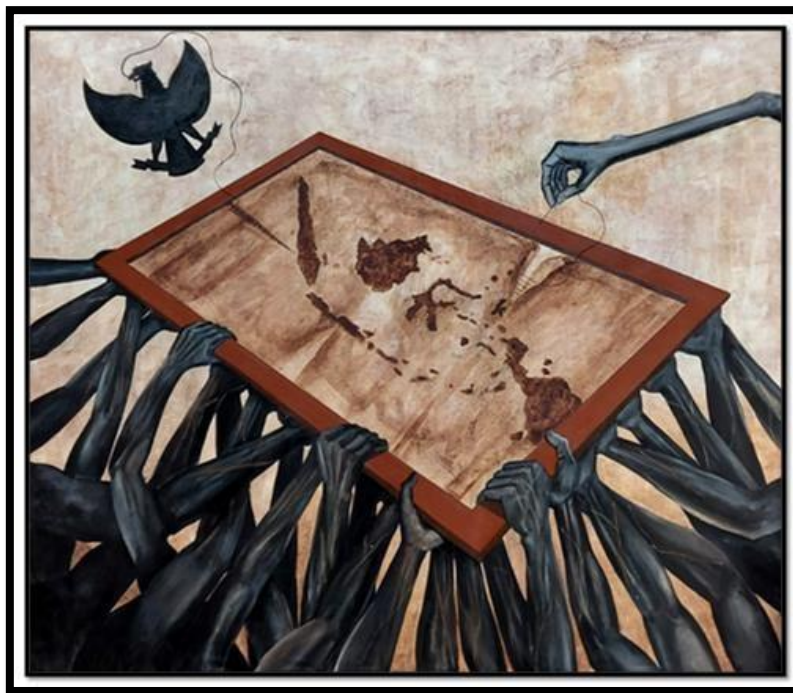
Gambar 1. Robek ; 130 x 150 cm; kopi dan akrilik pada kanvas, 2020

Akhir-akhir ini realitas pengotak-ngotakan terhadap golongan yang berseberangan semakin kerap terjadi. Saling menjatuhkan antarsesama putra bangsa, saling mencaki-maki, saling mengklaim paling benar, saling mengolok-