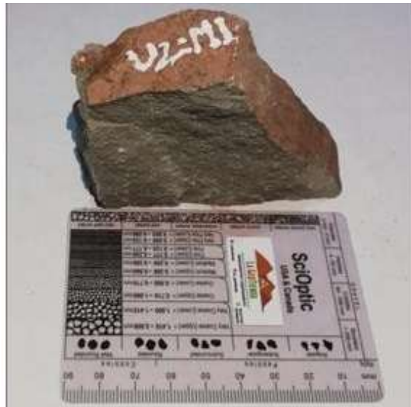
Figura 4. Arenisca limosa masiva compacta correspondiente a la muestra 1 de la unidad 2.

Arenisca Limosa con estructura masiva compacta, compuesta mineralógicamente por Cuarzo 80% Feldespato 5% Fragmento Lítico 3% Moscovita 5% y materia orgánica 7%, dando como resultado una Subarcosa según Folk 1974. Como se observa en la figura 4.