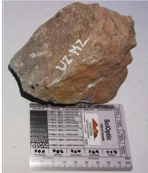
Figura 5. Arenisca Limosa correspondiente a la muestra 2. Unidad 2.