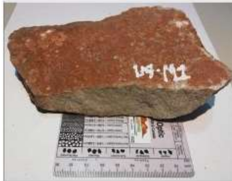
Figura 7. Arenisca estructura masiva compacta, correspondiente a la muestra 1 de la unidad 4.

En la figura 7, se observa una Arenisca estructura masiva compacta, compuesta mineralógicamente por Cuarzo 80% Feldespato 5% Fragmento Lítico 12% Moscovita 1% y Glauconita 2%, dando como resultado una Sublitarenita según Folk 1974.