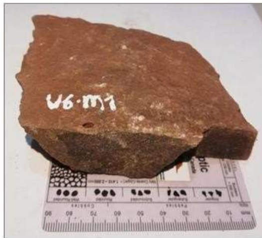
Figura 10. Limolitas una estructura masiva compacta muestra 1 de la unidad 6.

Limolitas una estructura masiva compacta, con porosidad alta. Como en la figura 10.