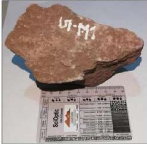
Figura 2. Muestra 1. Clasificada como Arenisca Limosa de la unidad 1.