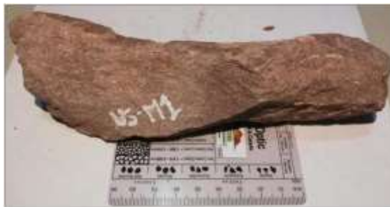
Figura 8. Arenisca Limosa correspondiente a la muestra 1 de la unidad 5.

Arenisca Limosa, como se observa en la figura 8, compuesta mineralógicamente por Cuarzo 72% Feldespato 15% Fragmento Lítico 11% y Moscovita 2%, dando como resultado una Subarcosa según Folk 1974.