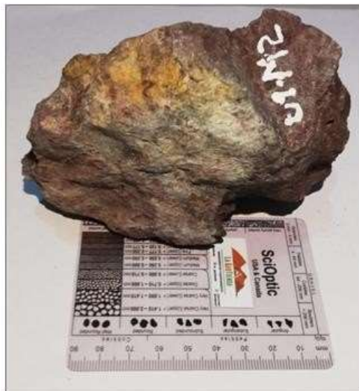
Figura 3. Limolita masiva correspondiente a la muestra 2 de la unidad 1.

Limolitas con estructura masiva compacta, porosidad alta. Hace parte de una alteración de glauconita. Como se observa en la figura 3.