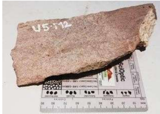
Figura 9. Arenisca Limosa con estructura masiva correspondiente a la muestra 2 de esta unidad.

Arenisca Limosa con estructura masiva, compuesta mineralógicamente por Cuarzo 74% Feldespato 10% Fragmento Lítico 14% y Moscovita 2%, dando como resultado una Sublitarenita según Folk 1974. Como se observa en la figura 9.