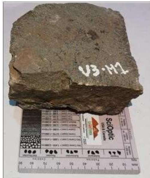
Figura 6. Arenisca Limosa con laminación paralela. Muestra 1 de la unidad 3.

Arenisca Limosa con laminación paralela, Compuesta mineralógicamente por Cuarzo 80% Feldespato 4% Fragmento Lítico 5% Moscovita 5% y Glauconita 6%, dando como resultado una Sublitarenita según Folk 1974. Como se puede observar en la figura 6.