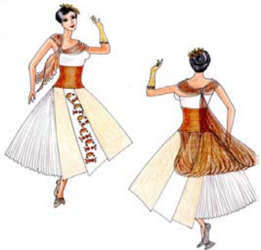
Figura 4. Diseño de la colección 'Boda y Folclor'

Por otro lado se logra una investigación con criterios conscientes de la cultura y raíces colombianas, enmarcados en unos antecedentes que se estudian y reconocen como propios desde hace 200 años, lo que sin duda representa el mayor y más importante punto de partida para promover la investigación.