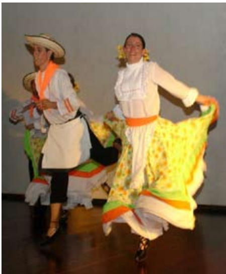
Figura 1. Bailarines Bambuco Nupcial

El trabajo creativo de un diseñador de modas requiere el aporte de diversos elementos. El presente proyecto investigativo surgió como una propuesta académica, que permitió al estudiante dar a conocer las tradiciones y manifestaciones culturales del territorio colombiano.