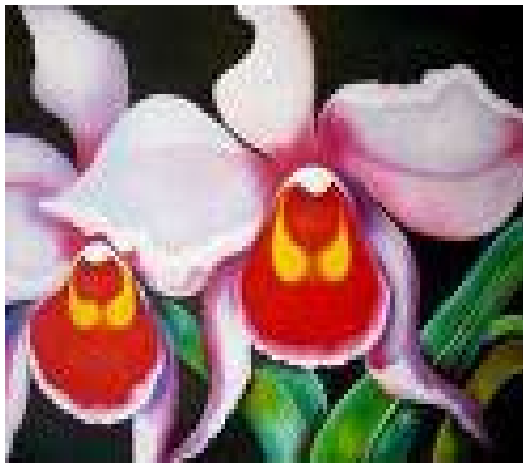
Figura 2. Orquídea. Flor autóctona colombiana

De acuerdo a la concepción que se tiene del manejo de la iconografía en los signos, se toman como elementos imprescindibles las flores, llevadas a un esquema abstracto, del cual se extrapola toda la esencia de la investigación, aplicadas no solo como referente sino también como concepto de apropiación de los recursos naturales autóctonos del país.