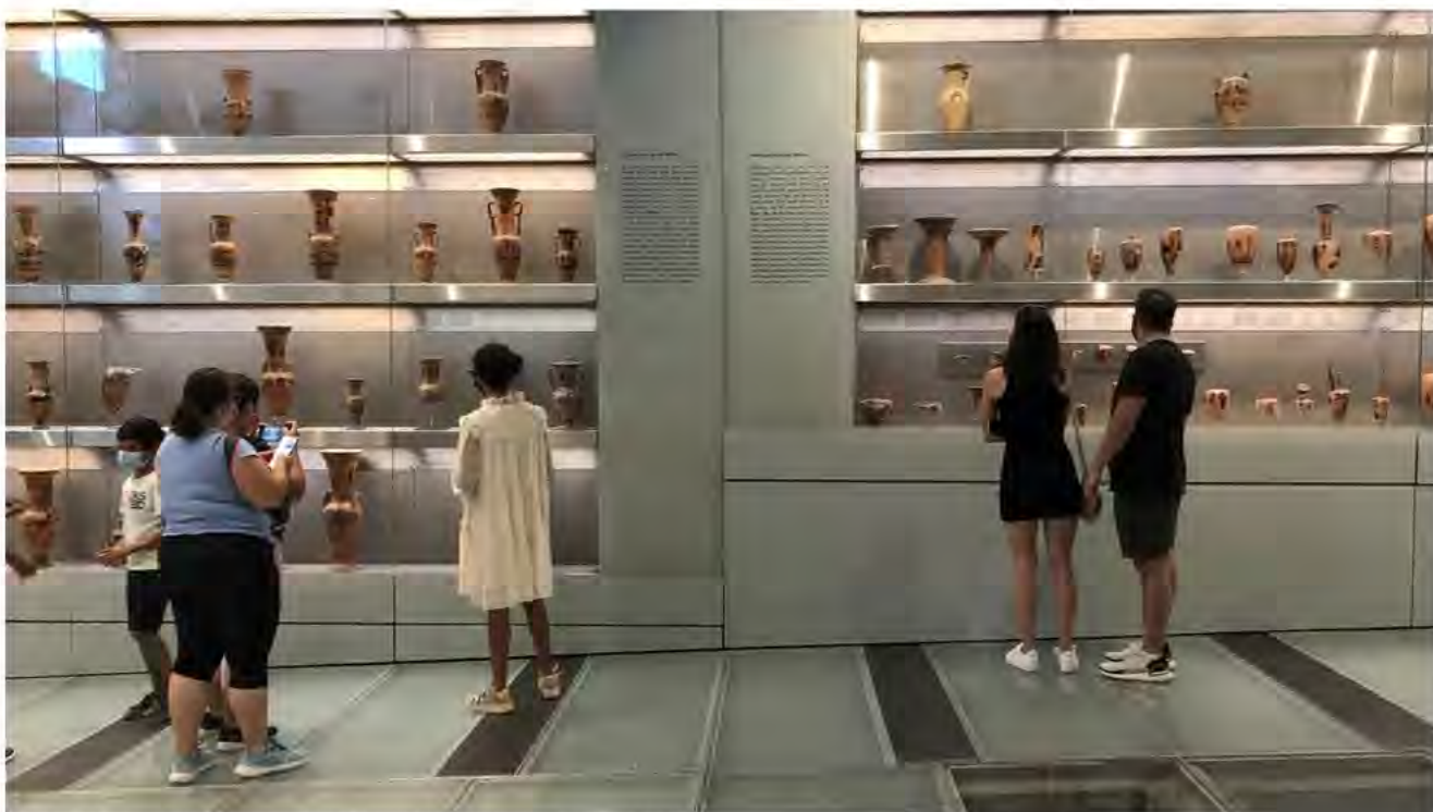
Fig. 3 Museo dell'Acropoli (Gianluca D'Agostino, Atene, 2022)

e una maggiore comprensione e apprezzamento dei valori del Patrimonio. Se già nel 1960 l'UNESCO aveva identificato l'importanza dell'accessibilità dei musei «a tutti, indipendentemente dallo status economico o sociale» 8 , le nuove Raccomandazioni del 2015 hanno consolidato il ruolo dei musei come luoghi di dialogo interculturale e di coesione sociale. Ai musei viene riconosciuta una funzione di responsabilità nella comunicazione e nell'educazione di un pubblico più ampio e sono incoraggiati a sostenere e promuovere politiche inclusive per raggiungere pubblici nuovi e diversi 9 . La rilevanza dell'interpretazione e della partecipazione delle comunità, come azioni volte a garantire accessibilità e inclusione, è stata recentemente ribadita dalla nuova definizione di museo dell'ICOM, in quanto luogo di promozione della diversità e sostenibilità 10 .