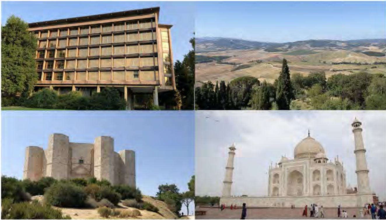
Fig. 1 Patrimonio Mondiale nelle sue diverse forme (Gianluca D'Agostino, Uffici Olivetti, Ivrea; Val d'Orcia; Valle dei Templi, Agrigento; Taj Mahal, Agra; 2022).

culturale e i legami tra il Patrimonio e la pluralità di individui che vi si relazionano e identificano rendono cruciali la messa in atto di processi partecipativi volti all'accessibilità e all'inclusione, anche grazie al ruolo di musei e centri di mediazione.