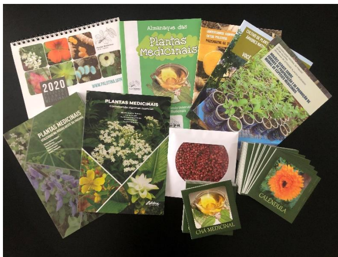
Figura 2. Calendários, jogos didáticos, cartilhas, livros elaborados com a temática plantas medicinais para a difusão dos conhecimentos junto à comunidade.

Sabe-se que popularmente as plantas medicinais são muito mais conhecidas e indicadas para uso oral, na forma de chás, ou uso externo (tópico), no entanto também podem ser utilizadas de outras formas, como na preparação de sucos, de pratos salgados ou doces. Essas formas alternativas de uso motivaram a elaboração de um livreto (1ª e 2ª edição) que reúne receitas caseiras (Figura 3). Com esta iniciativa, além de ter a oportunidade de conhecer as plantas e utilizá-las para a melhoria da saúde, os grupos parceiros também tem a oportunidade de degustar as preparações, que além de saborosas são naturais. O livreto contém receitas que vêm acompanhadas de fotos das espécies medicinais utilizadas nas preparações e de informações sobre o seu uso para a saúde. Com a distribuição destes materiais espera-se poder compartilhar com a comunidade um pouco do conhecimento produzido através da extensão ao longo dos anos de atividades.