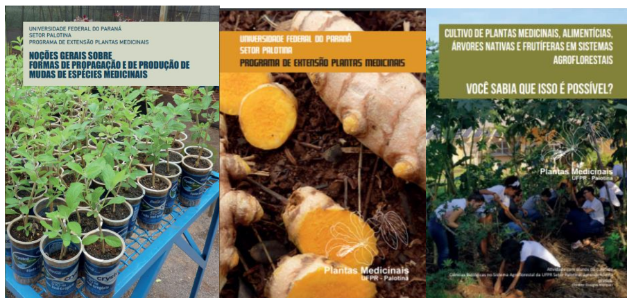
Figura 5. Cartilhas informativas produzidas no ano de 2019.

Superando os desafios da pandemia e para comemorar os 25 anos de atividades, idealizou-se uma mascote que recebeu o nome de Flora (Figura 6a). Ela representa uma menina muito curiosa que cultiva plantas e aprecia chás medicinais. A Flora foi elaborada para despertar o interesse das crianças e a curiosidade dos adultos pela temática.