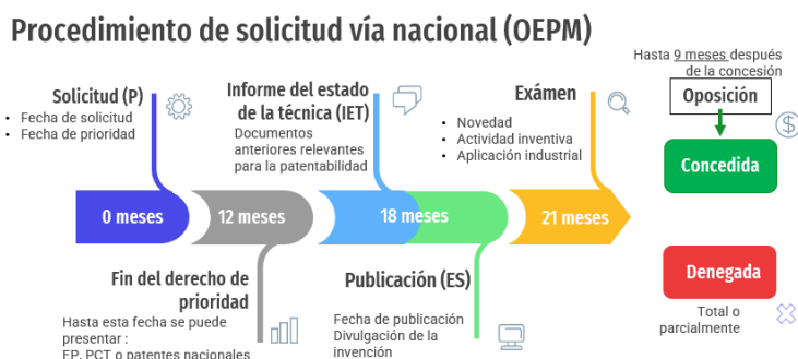
Figura 2. – Esquema del procedimiento de solicitud de una patente por vía nacional. En él se recogen las principales fases del procedimiento de solicitud de patente establecidas en una línea de tiempo (0 meses hasta 21 meses).

Tras el análisis de las modificaciones, la OEPM podrá conceder, si se han subsanado las objeciones, o denegar parcial o totalmente la patente, si no se han subsanado correctamente. Aun así, una patente concedida puede ser objeto de oposición por terceros en los 9 meses posteriores a su concesión, siendo el último recurso para impugnar la patente ante la oficina nacional.