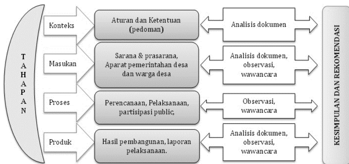
Gambar 1. Desain evaluasi program

membantu agar hasil evaluasi tetap difokuskan pada manfaat yang penting dan akhirnya untuk membantu pihak terkait dapat mengetahui kesuksesan program dalam mencapai tujuan. (Wirawan, 2016)