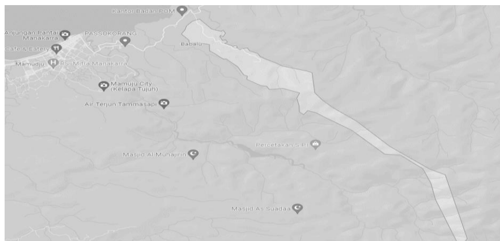
Gambar 3. Peta desa batu pannu

Luas wilayah desa mencapai 10,79 km 2 , dengan jumlah penduduk 1473 Jiwa. Desa Batu Pannu berada pada kisaran ketinggian 40 mdpl (02° 38' 10,8" LS 118° 53' 14,85" BT) dan curah hujan 114 HH/Tahun, rata-rata suhu udara 28° - 32° Celsius. Bentuk wilayah desa memanjang dari arah barat ke tenggara dengan dikelilingi oleh desa bambu, desa tadui dan kelurahan Mamunyu. Desa Batu Pannu seluruh wilayahnya dikelilingi oleh pegunungan dan subur. Tumbuhan di desa ini didominasi oleh durian dan langsung, selain hutan primer. Selain itu, di daerah ini juga dengan mudah kita temukan berbagai fauna berupa beberapa jenis burung dan rusa.