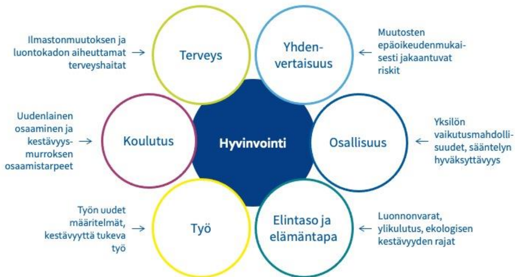
Kuva 2: Kestävyysmurroksen, sosiaaliturvan ja hyvinvoinnin väliset yhteydet.

Kestävä hyvinvointi on laveasti määriteltynä sitä, että kaikilla on mahdollisuus hyvään elämään luonnon kantokyvyn rajoissa, nyt ja tulevaisuudessa. Ihmiskeskeisesti ajateltuna kestävä hyvinvointi viittaa ihmisten hyvinvointiin ja hyvinvoinnin sosiaaliseen oikeudenmukaisuuteen, mutta kestävä hyvinvoinnin tutkimus laajentaa näkökulmaa myös ihmisten ja luonnon yhteyteen sekä elonkehän hyvinvointiin. Koska ihmisten hyvinvointi on lopulta riippuvaista elonkehästä, ei ihmisten hyvinvoinnin tavoittelun tulisi ylittää ekologisen kestävyuden rajoja. Planetaarinen hyvinvointi viittaa sekä inhimillisen että ei-inhimillisen hyvinvointiin, kokonaisten ekosysteemiprosessien toimintakyvyn turvaamiseen. (Esim. Helne & Hirvilampi 2021; JYU.Wisdom 2021.)