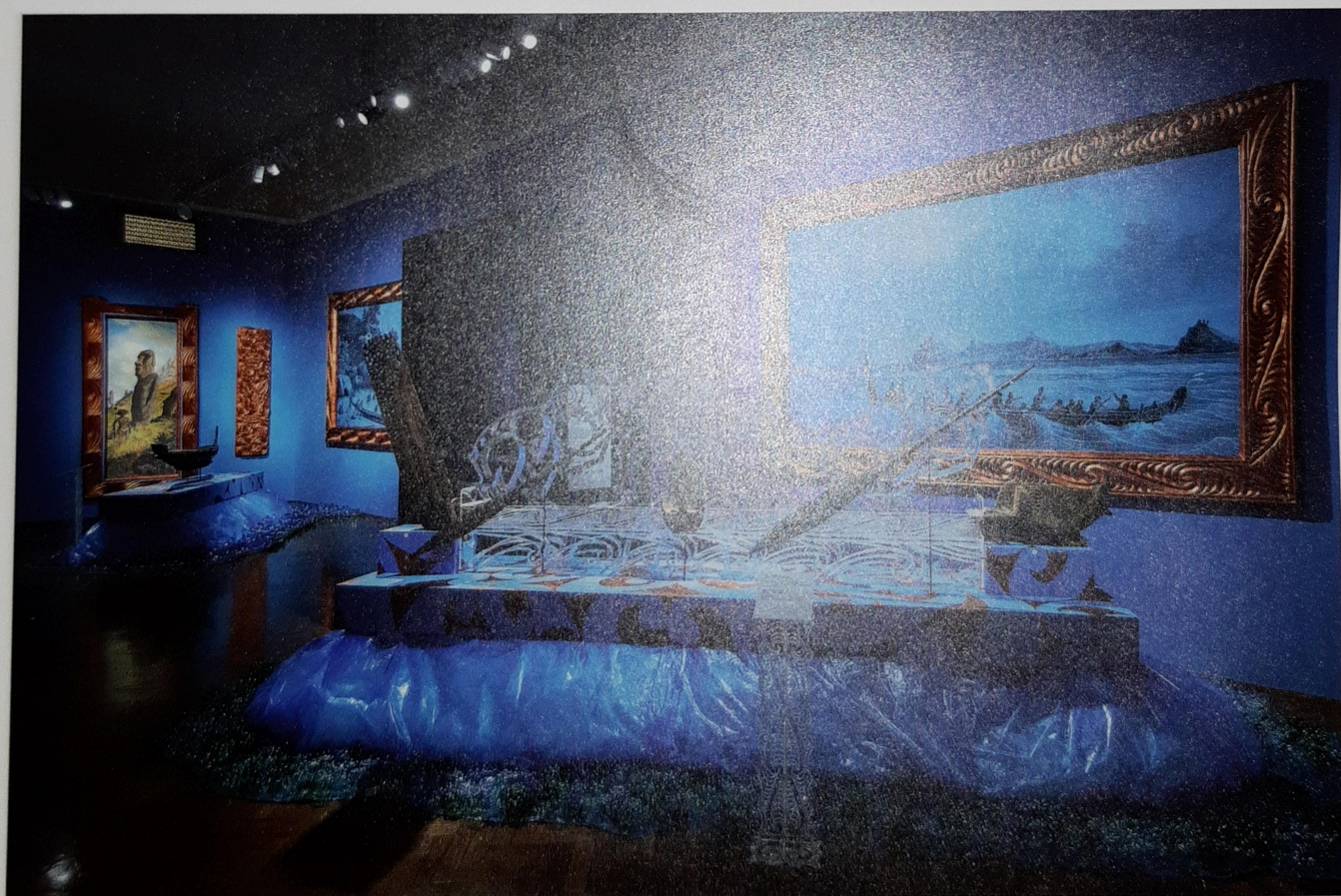
Nuku lastikkanotist láá tovlááh muorâúásih museonurâlduvâin sehe suu veerrâm pleksilasâúásih já madâräijihmiällooh.