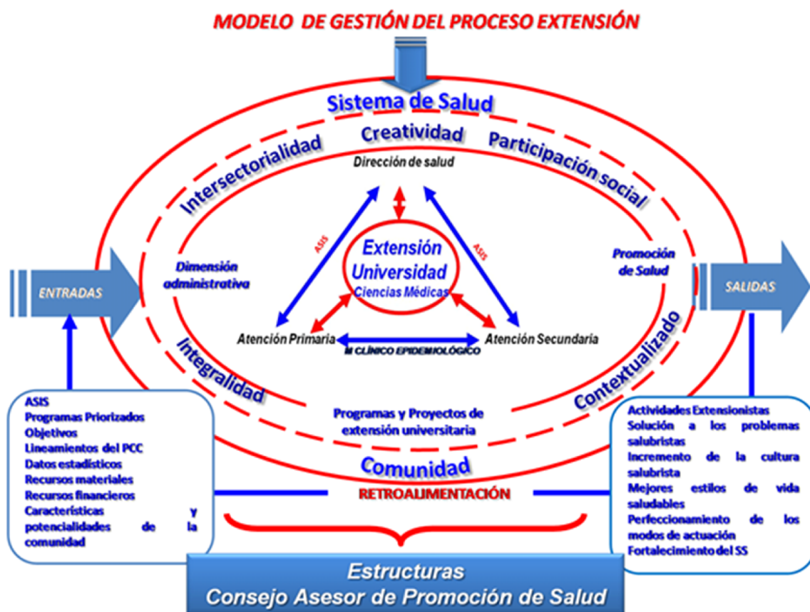
Figura 2. Modelo de gestión del proceso extensionista en la Universidad de Ciencias Médicas de Pinar del Río.

conscientemente para su beneficio, los estilos de vida favorables. Cada comunidad tiene sus necesidades sentidas y los métodos y herramientas para lograr un empoderamiento de la población para que esta modifique favorablemente sus estilos de vida que son diferentes. La valoración de cada una de estas ideas permitió ir comprendiendo la complejidad del modelo del proceso de extensión en la Universidad de Ciencias Médicas de Pinar del Río. ( Figura 2)