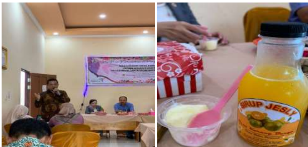
Gambar 2. Pelaksanaan Pelatihan & Hasil Olah Jeruk Siam

Sudah berpengalaman dalam memandu wisatawan asing. Materi yang disampaikan berkaitan dengan hal apa saja yang perlu dilakukan pada saat menjadi pemandu wisata, terutama apabila terdapat wisatawan asing yang berkunjung. Selain itu, diperlihatkan pola hasil olah dari jeruk siam yang menjadi potensi penghasil dari Desa Karang Bunga. Lebih jelasnya dapat dilihat pada gambar di bawah ini.