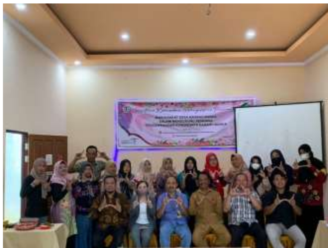
Gambar 3. Foto Bersama dengan Peserta

yang dilakukan dapat berjalan dengan baik dari awal hingga pada tahap proses pendampingan.