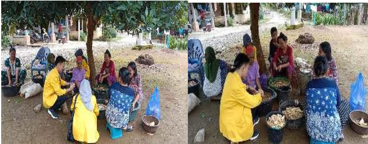
Gambar 2. Sosialisasi Kepada Masyarakat

kurangi 1 kali sehari. Sampai lengkuas tersebut sudah tumbuh lebih banyak maka tidak perlu lagi di siram sampai lengkuas bisa di panen pada umur 6 bulan. Dan lengkuas bisa di pupuk supaya bisa menghasilkan isi lengkuas yang besar dan berkualitas.