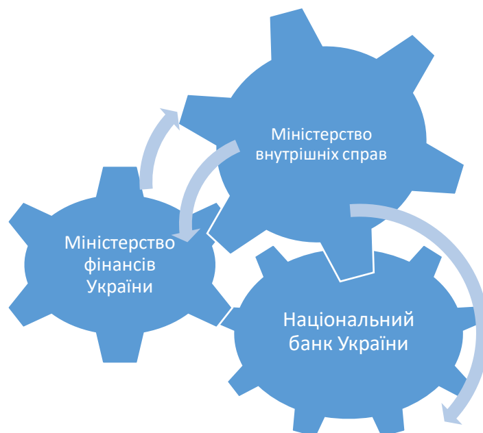
Рис. 2. Державні інституції, відповідальні за процеси євроінтеграції [2]

На Рисунку 2 представимо інституції, відповідальні за процеси здійснення механізму економічної євроінтеграції національних компаній, та очікувані результати від їх діяльності.