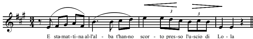
Es. 1. P. Mascagni, Cavalleria rusticana , Duetto Santuzza-Turiddu, parte I, bb. 38-41

L'inizio del duetto tra Santuzza e Turiddu è caratterizzato da un serrato botta e risposta circa il luogo in cui questi ha trascorso la notte (bb. 1-37). 4 Alle menzogne di Turiddu, Santuzza ribatte cantando la seguente frase: