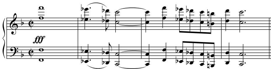
Es. 5. P. Mascagni, Cavalleria rusticana , Finale, bb. 233-6

La constatazione dell'esistenza di una modalità di commento orchestrale "esterno", diverso rispetto ai casi appena descritti, potrebbe indurre ad avanzare la tesi della volontarietà del compositore nell'impiegare il procedimento drammaturgico-musicale ora discusso: il commento orchestrale che segue l'urlo di donna che annuncia la morte di Turiddu è affidato ad un motivo strumentale (cfr. Es. 5) cui non si può associare un significato preciso proprio perché, a differenza di quelli trattati sopra, nel corso dell'opera non ricorre mai in associazione ad una frase verbale di qualche personaggio. Fatto che autorizza a catalogare tale motivo come appartenente alla sfera del linguaggio dell'autore e, pertanto, come commento esterno.