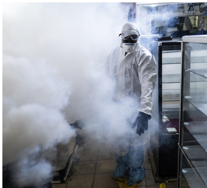
Un employé municipal à Dakar, au Sénégal, utilise un fumigateur pour désinfecter le marché de Tilene dans le quartier de Medina, tandis qu'à l'extérieur un bulldozer démolit des magasins informels pour arrêter la propagation de la COVID-19.

Ndung'u, N. and Shimeles, A. (2021) 'Trade-Offs between Lockdown Measures to Control the Spread of the Covid-19 Pandemic and the Economic and Social Consequences', paper presented at the virtual 23rd Senior Policy Seminar, AERC, 30 March 2021