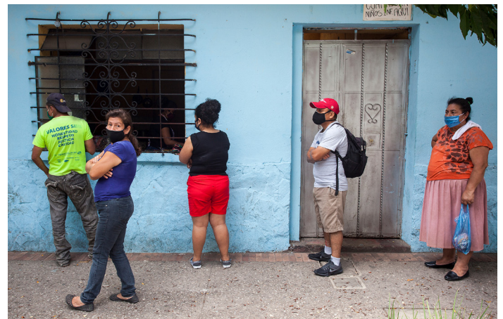
Les gens font la queue pour acheter des tortillas dans un magasin local après qu'un confinement a été ordonné par le président du Guatemala pour contenir la COVID-19.