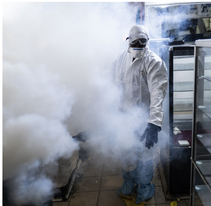
Un trabajador municipal en Dakar, Senegal, usa un fumigador para desinfectar el mercado de Tilene en el barrio de la Medina, mientras afuera, una excavadora demuele negocios informales para detener la propagación del Covid-19.

Ndung'u, N. and Shimeles, A. (2021) 'Trade-Offs between Lockdown Measures to Control the Spread of the Covid-19 Pandemic and the Economic and Social Consequences', paper presented at the virtual 23rd Senior Policy Seminar, AERC, 30 March 2021