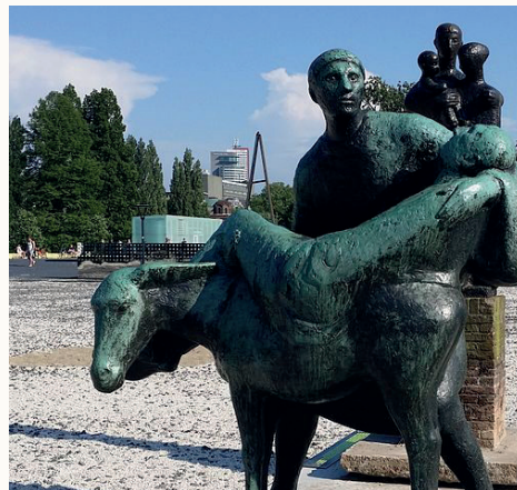
Afbeelding 4. De Barmhartige Samaritaan

Het dubbelgebod onze naaste lief te hebben als onszelf blijft onverminderd van kracht, in het recht, de rechtstheologie, het kerkrecht en daarbuiten. Niemand is te groot om een kleine barmhartige samaritaan te zijn. Heb uw naaste lief als uzelf!